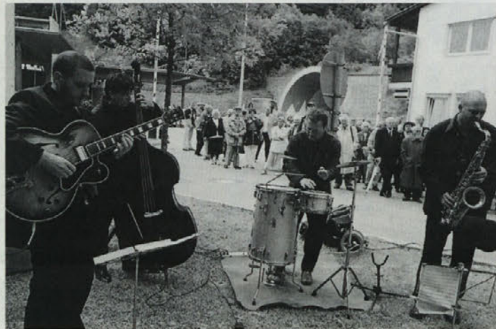
Glasbeniki so krstno izvedli svečanosti namenjeno kompozicijo