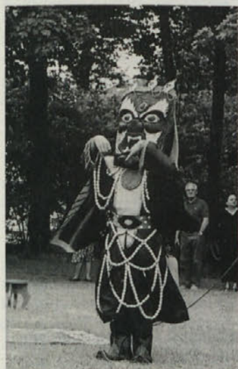
Obredni ples v čast bogovom

Mongoli so bili v Borovljah. Prišli so konec minulega tedna in ostali so do torka, 13. junija. Prišli so na povabilo avstrijsko-mongolske družbe in predstavili so svojo nadvse bogato kulturo. V naši zavesti so Mongoli še vedno tisti divji jezdec iz azijskih step, ki so od 13. stoletja naprej pod legendarnim Džingis Kanom in njegovimi potomci bili trepet in strah Evrope. Pred njimi so to bili Huni, Ostri in Ogri (Madžari). Džingis Kan je sploh vzpostavil doslej največje kraljestvo sveta, ki je segalo od obal Tihga oceana do Srednje Evrope. Sedež njegovega kraljestva je bilo mesto Karakorum v puščavi Gobi.