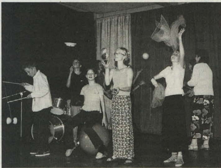
Dijaki in dijakinje pri izvedbi projekta