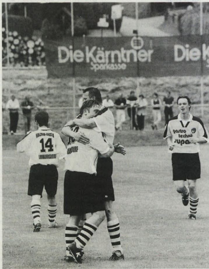
Ekipa iz Bilčovsa si je zaslužno zagotovila obstoj v podligi