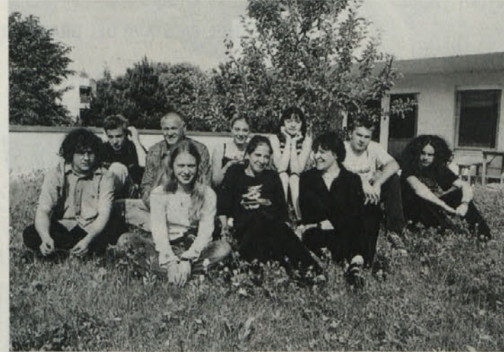
Po opravljenem delu: skupina na vrtu radia AGORA