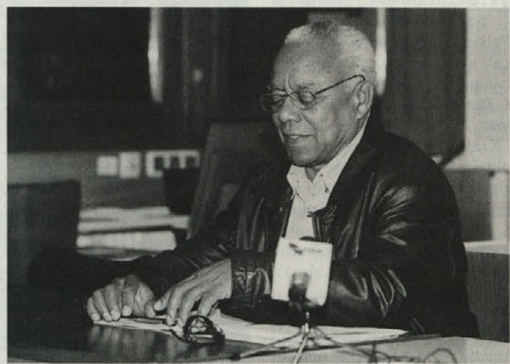
Predavatelj Neville Alexander iz Južne Afrike

Da dijaki niso zahtevali pouka tudi v svojih materinščinah, je posledica kolonializma, ki je spodrezal korenine ozaveščenosti za lasten jezik. Angleščina in francoščina sta danes v Afriki tako rekoč uradna jezika, jezika vzpona in kariere, »linguae francae« ali »obča občevalna jezika«, kar vodi v razvrednotenje avtohtonih jezikov. Neville Alexander zato v soglasju s tezami in zahtevami, ki so jih leta 1996 v Accri sprejeli afriški ministri za pouk, da je treba skrbeti za izobrazbo v domačih jezikih, zahteva šolsko izobraževanje v treh jezikih: v materinem jeziku dijaka, v angleščini in še v tretjem jeziku