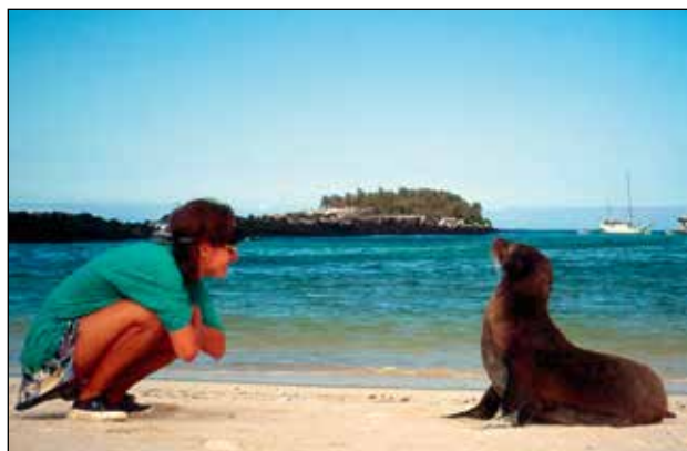
"Vse sva se zmenila." V pogovoru z mrožem na Galapaških otokih.