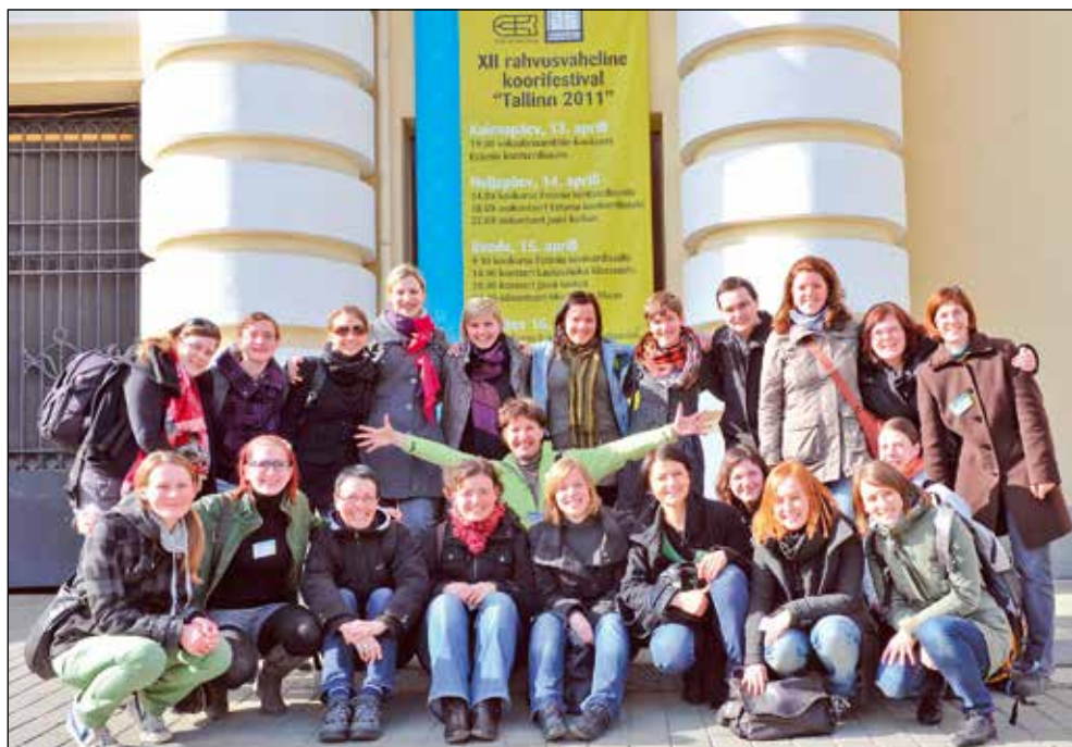
Pred dvorano v Talinu.

Na tekmovanju, kot ga organizirajo v Talinu, zbori tekmujejo v posameznih kategorijah. Ob zaključku tekmovanja pa se še enkrat (s popolnoma novim programom!) predstavi prvih šest po točkah najvišje uvrščenih zborov iz vseh kategorij. Šmikle smo se zavedale, da gremo na zborovsko tekmovanje visoke kakovostne ravni in tudi pomanjkljivosti, ki jih moramo v svojih izvedbah še odpraviti, zato sama uvrstitve v grand prix nisem pričakovala, česar pa ne morem trditi za ostale Šmikle (smeh!). Zavedala sem se namreč, da ima žirija pred seboj notni zapis in vsaka napaka pomeni odbitek točk. Na srečo meri-