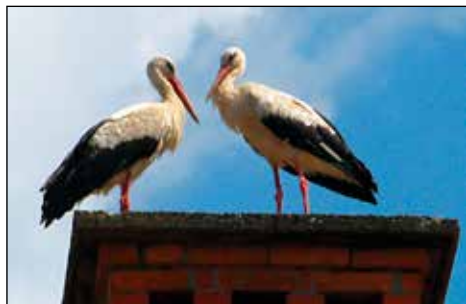
Pogled iz Nagličeve dnevne sobe.

Ja. Pustili so mi živeti in omogočili, da razvijem svoje talente (smeh). Problem se je pojavil le pri izbiri med glasbeno šolo ali šolo smučanja v drugem razredu osnovne šole. Šola smučanja je predstavljala staršem prevelik finančni zalogaj, zato sem pristala v glasbeni šoli.