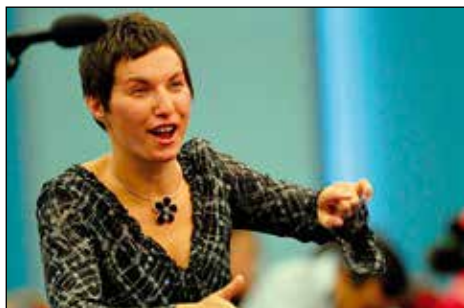
Na Ohridu – neopazna zborovodkinja.

Enkrat sem bila res "kregana", ker sem imela prekratko krilo! Res je zborovodja tisti, ki zakriva, ki stoji na poti med pevcem in poslušalcem. In če zbo-