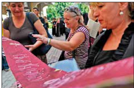
Gospe, ki občudujejo šale na Ohridu.