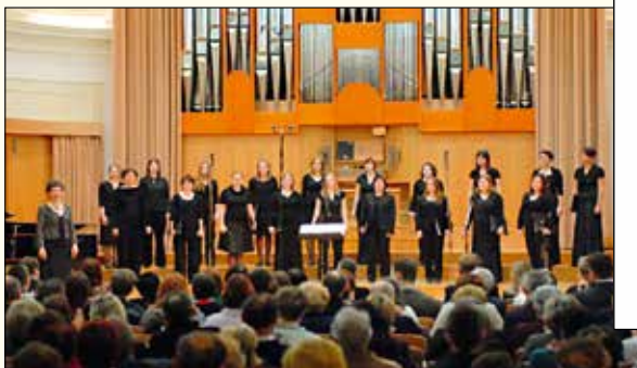
Nastop v Slovenski filharmoniji v Ljubljani.