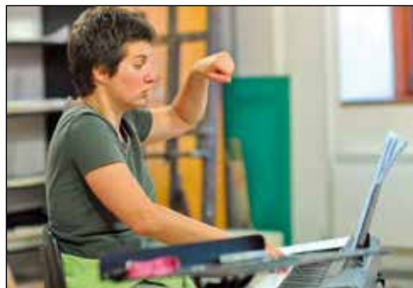
Zborovodkinja na vaji.

Ne moreš, ker je fizično določeno. Določenih nižin ne moreš doseči, če imaš kratke in tanjše glasilke oziroma določenih višin ne, če so glasilke odebeljene in dolge. S tehnikami petja se priučiš, da je razpon zvena tvojih glasilk čim večji. Če pogledamo "nepevce", ti najlažje in najboljše pojejo v govorni legi, ker jo tudi največ uporabljajo. In če bo pel višje, česar ni vajen, in ne bo uporabil trebušnih mišic, celega telesa, ker v vratu ne bo ohranil prožnih mišic, si bo mislil, da visoko ne more zapeti, kar pa sploh ni nujno.