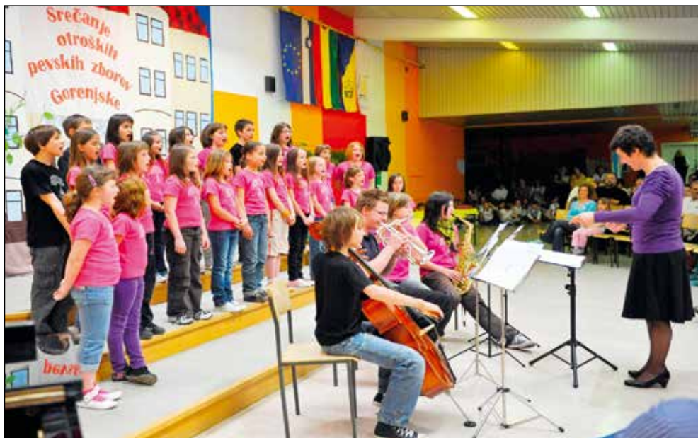
Otroški pevski zbor OŠ Železniki 2009/10.

Gre za eno in isto, pa vendar za povsem različen način dela. S tretješolci ne morem delati na enak način kot s Šmiklami, pa čeprav vsi enako radi klepetajo (smeh). Način dela z otroškim zborom se povsem razlikuje od dela z mladinskim zborom in od dela s Šmiklami. Kar pa mi je zelo všeč in je skupno vsem brez izjeme, je doživljanje, ki je enako pri vseh treh.