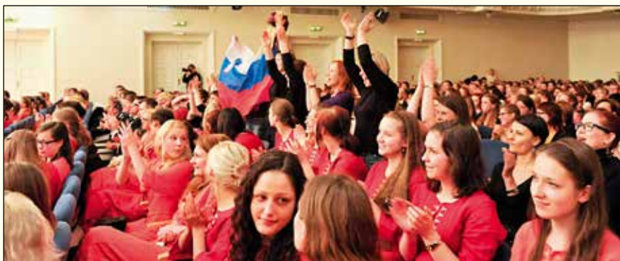
Veselo presenečenje v Talinu.