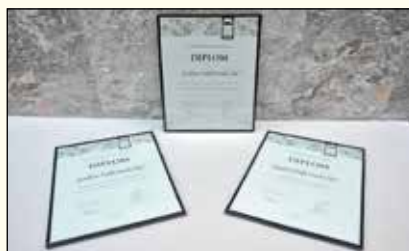
Priznanja iz Talina.

APRILA 2011 SO SE UDELEŽILE 12. MEDNARODNEGA ZBOROVSKEGA TEKMOVANJA V TALINU V ESTONIJI IN PREJELE PRVO NAGRADO V KATEGORIJI SODOBNA GLASBA IN DRUGO NAGRADO V KATEGORIJI ŽENSKI ZBORI. PREJELE SO TUDI NAJVIŠJE ŠTEVILO TOČK MED VSEMI ZBORI TEKMOVANJA.