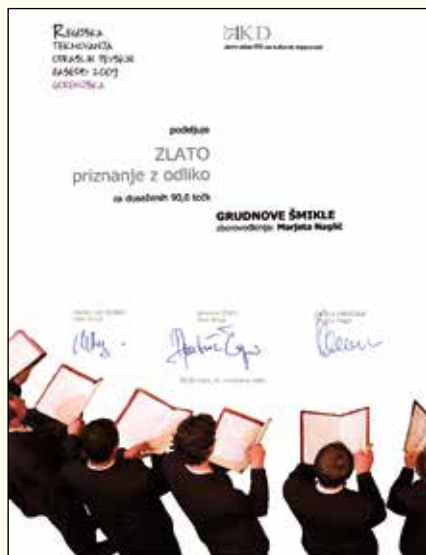
Posebno priznanje za najboljši ženski zbor tekmovanja. Zlato priznanje z odliko za doseženih 90 točk.