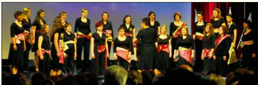
Nastop na Naši pesmi.

APRILA 2011 SO SE UDELEŽILE 12. MEDNARODNEGA ZBOROVSKEGA TEKMOVANJA V TALINU V ESTONIJI IN PREJELE PRVO NAGRADO V KATEGORIJI SODOBNA GLASBA IN DRUGO NAGRADO V KATEGORIJI ŽENSKI ZBORI. PREJELE SO TUDI NAJVIŠJE ŠTEVILO TOČK MED VSEMI ZBORI TEKMOVANJA.