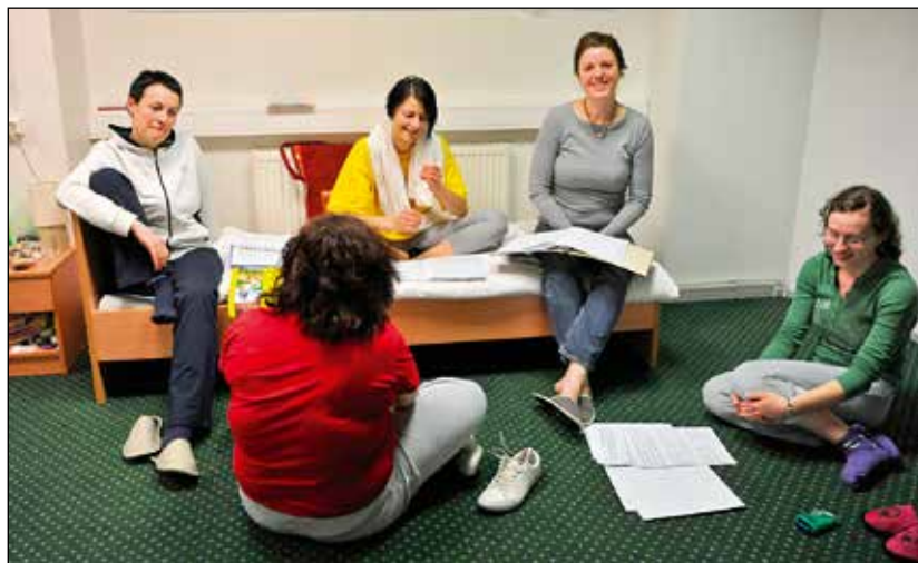
Drugi alt na ekstra vaji.