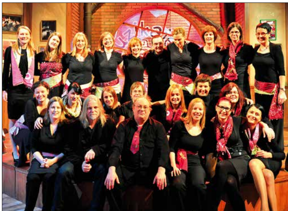
Snemanje oddaje Muzikajeto .