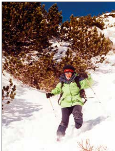
Novoletni spust s Kredarice.