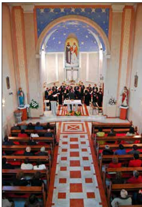
Od septembra do decembra 2008 je prevzela tudi dirigentsko vlogo.