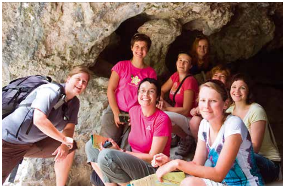
Izlet v Rezijo.

Idealen zbor je nekaj podobnega kot perfektna izvedba. Zbor je živ organizem, ki se spreminja, raste