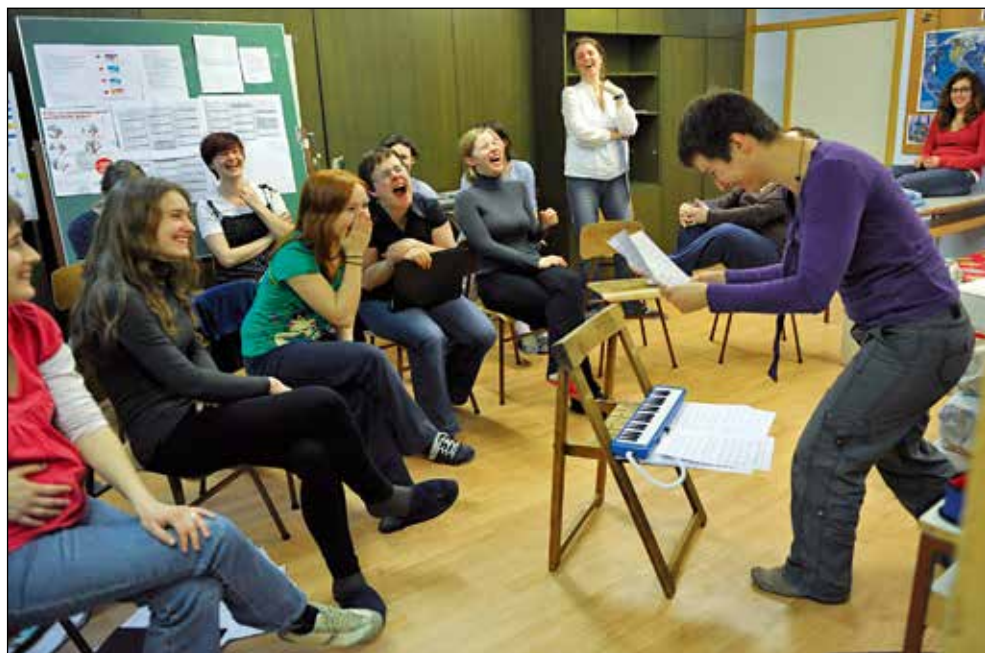
Ko spregovori tišina.

Hm. Odlično vprašanje. Brez ure je včasih nemogoče ugotoviti, kako dolga je ena sekunda. Ko si na odru, je utrip tvojega srca hitrejši kot normalno, zato je občutek, kako dolga je ena sekunda na odru, lahko varljiv. Pogosto se mi zgodi, da izvedemo neko skladbo na vaji v popolnoma drugačnem tempu kot potem na odru. Potrebovala sem veliko izkušenj, da sem se navadila odreagirati na akustiko, na zvok v prostoru in ob vsem tem še kontrolirati svoj utrip.