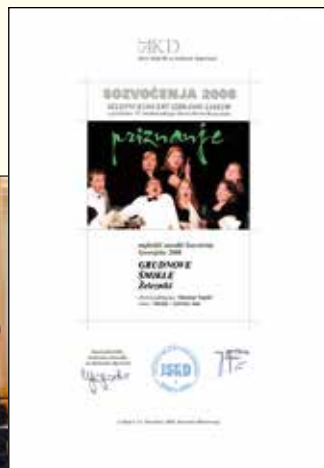
Priznanje s Sozvočenj 2008.