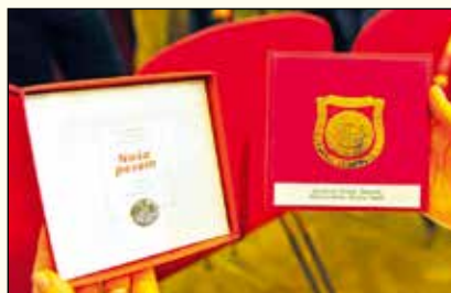
Zlata plaketa z 21. slovenskega zborovskega tekmovanja Naša pesem v Mariboru.

LETA 2010 SO NA SLOVENSKEM ZBOROVSKEM TEKMOVANJU NAŠA PESEM V MARIBORU OSVOJILE ZLATO PLAKETO IN POSEBNO PRIZNANJE TER NAGRADO ZA IZVEDBO SODOBNE SLOVENSKE SKLADBE, NAPISANE PO LETU 1980.