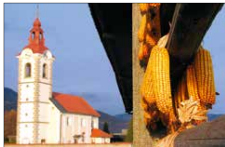
500-let stara spodnjebrniška cerkev in koruza (asociacija na Mihaelin zapis).

V srednji šoli sem bila glasbeno ves čas dejavna; sodelovala sem pri različnih kulturnih prireditvah pa tudi med prijatelji sem imela veliko glasbenih navdušencev. Ob pripravah za maturo smo se odločali tudi, kako in kaj naprej. Spomnim se, da me v študij glasbe niso usmerili niti starši niti šola, ampak sem med razpisi, oziroma možnostmi, ki sem jih imela za nadaljnji študij, videla razpis študija glasbena pedagogika. Ja, še to: k temu me je spodbudilo tudi dejstvo, da sem zadnja dva letnika v srednji šoli pridobivala prve izkušnje z učiteljskim poklicem; učila sem otroke igrati klavir, kar tako, po svoje.