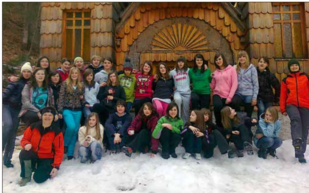
Mladinski pevski zbor OŠ Železniki 2010/11.

Sem domoljub, tega se zavedam že kar nekaj časa. Spomnim se, da smo morali pri pouku slovenščine v času osamosvajanja Slovenije, v začetku leta 1990, še pred plebiscitom, o katerem pa se je že govorilo, izdelati reklamni letak. In nalepila sem vremensko sliko, karto iz časopisa, in pripisala: "Vremena Kranjcem bodo se zjasnila!" ter: "Plebiscit". Na to sem ponosna. Dokaz mi je, da so otroci, mladina izjemno sposobni dojemati okolico in dogajanje okrog njih, razmišljati, se izražati, delati ... Ne smemo jih podcenjevati. In iz tega narodoljubja, slovenceljubja imam izjemno rada slovensko ljudsko pesem, in tudi če se čustveno distanciram od nje, so to izjemne skladbe, ki nosijo v sebi ogromno bogastva. Naravne so, zrcalijo pokrajino, niso izumetničene, niso izsiljene, so odraz nekega čutenja, življenja. Saj ljudsko je ravno to, da se v