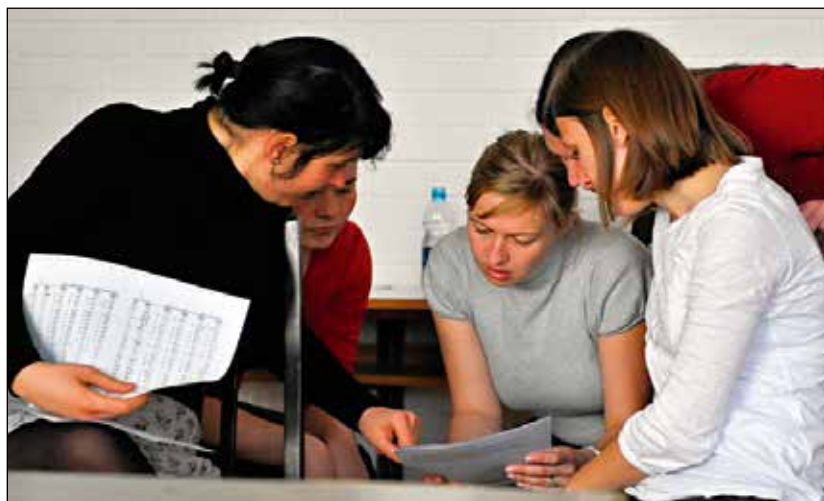
Prvi sopran, kadar zborovodkinja dela brez podnapisov.

Ljudje moramo znati sobivati. Pevci, ki so del zбора, morajo znati sobivati. Šmikle to "treniramo". Ni samo po sebi umevno, ampak je za to potreben trud vsake posebej. Dekleta so stara med 18 in 45 let. Kaj vse se nam v takšnem obdobju življenja dogaja,