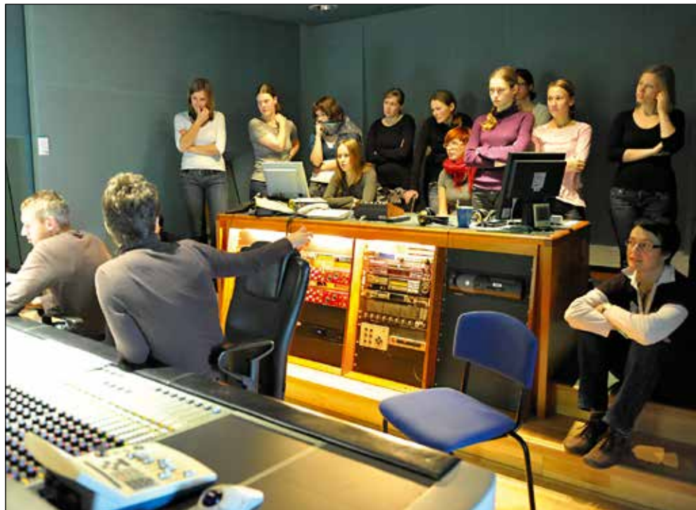
Studijsko snemanje na RTV Slovenija.

Rada berem, a med letom težko najdem čas zanje. Če vzamem v roke knjigo, jo bom brala, dokler je ne preberem, to pa v delu leta z več obveznostmi ne gre. Če bom med letom imela na izbiro branje in izlet v hrib, bom šla v hrib. Se pa skozi leto nabere cela vrsta zgodb, ki jih prebiram v poletnih mesecih. Strokovno literaturo in dnevno časopisje vse večkrat poiščem na internetu.