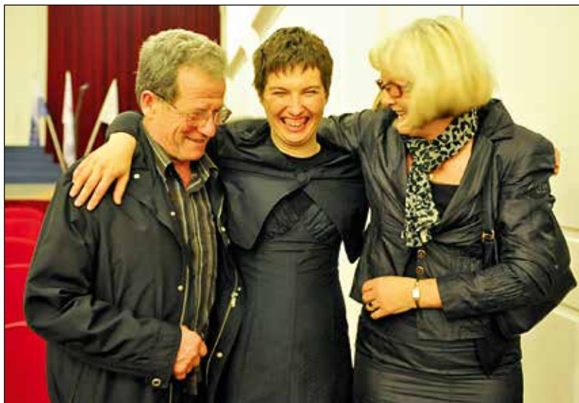
S staršema po razglasitvi rezultatov v Mariboru.