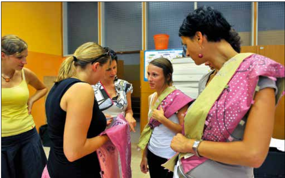
Kreatorka Bedene prinese svilene šale.

Pestro in enotno. Najprej moram priznati, da mene videz nikoli ni obremenjeval, zagotovo ne toliko kot moja mami. Pomembno je, kako se človek počuti, saj tako, kot se človek počuti, tudi zgleda. Kar pomeni: če se dobro počuti v razcapanih oblačilih, naj ima pa razcapana. Pred nekaj leti, ko smo si ogledovale fotografije, smo začele bolj razmišljati tudi o videzu, in ugotovile, da nam ne bi bilo všeč, če bi imele vse