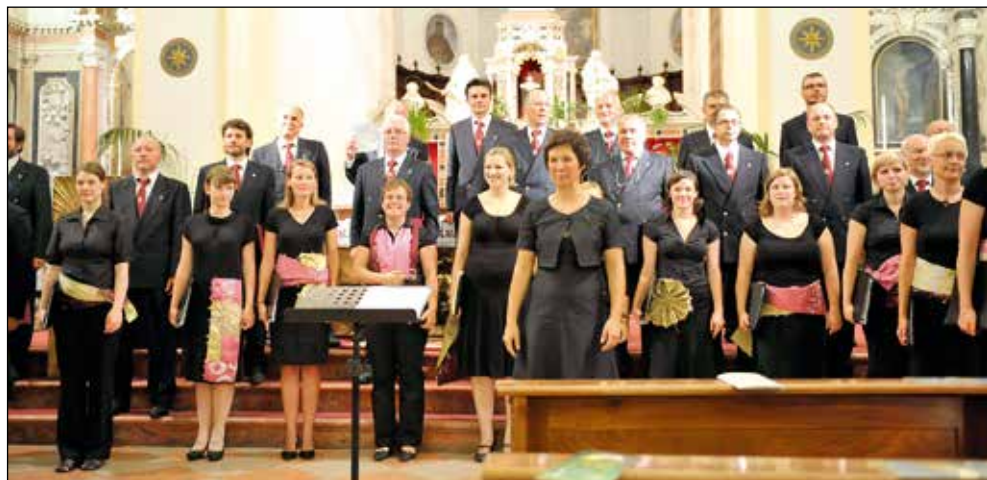
V Vidmu.