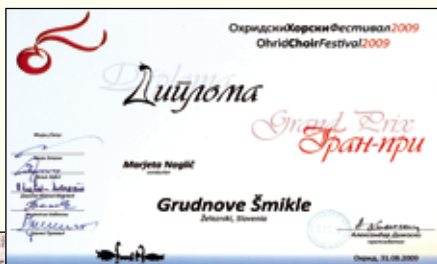
Priznanje z Ohrida.