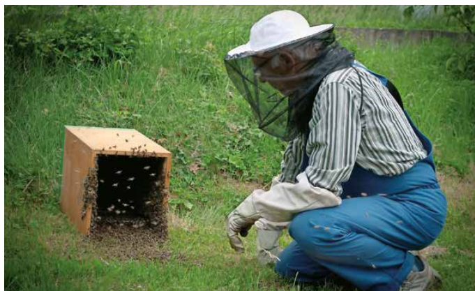
Do čebeljih družin lahko pridemo z nakupom roja.

Najpreprosteje in najceneje je prodati čebeljo družino na starem satju, ki je črno do temno rjavo, leseni satniki pa so temno rjavi. Čebelarjem, ki se hočejo s prodajo čebeljih družin znebiti starega satja, se zahvalimo za takšno medvedjo uslugo in čebelje družine raje kupimo drugod. Prav tako se včasih zgodi, da čebelar pred prodajo v čebelji družini zamenja sat zalege s starim praznim satom. S prodajalcem se dogovorimo, da s seboj prinesemo svoj panj in vanj preložimo čebeljo družino. Tako bomo zanesljivo vedeli, kako močno čebeljo družino smo kupili, na koliko satih je zalega, kako matica zalega, kolikšna je količina hrane in na kakšnih satih je družina.