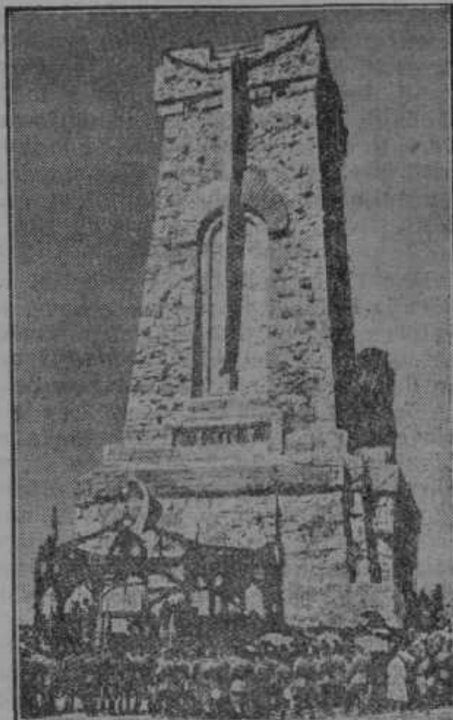
Na Bolgarskem so odkrili spomenik kot spomin na osvoboditev izpod turškega jarma leta 1877. Spomenik je v Šipka prelazu.