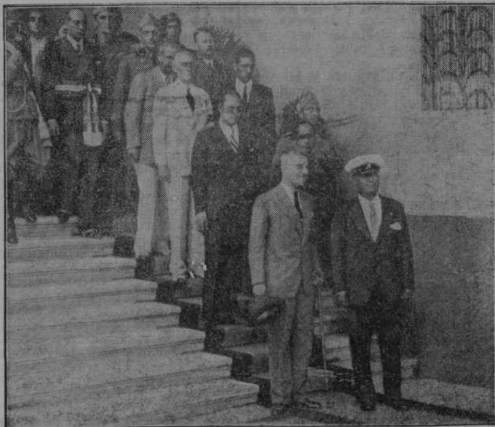
Avstrijski kancler Schuschnigg v Florenciji na obisku pri Mussoliniju. Na tej sliki vidimo spredaj kanclerja in Mussolinija.

Strahovita eksplozija. V mestu Campano, 80 km od argentinske prestolice Buenos Aires, so eksplodirala skladišča surovega olja, last podjetja »Standard Oil Compagny«. Zletelo je v zrak nad