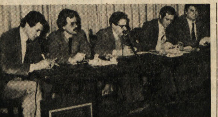
Med včerajšnjo sindikalno konferenco

Predstavniki FLC so poročali o poteku obiska delegacije jugoslovanskega sindikata v Italiji - Regularizirati položaj tuje delovne sile