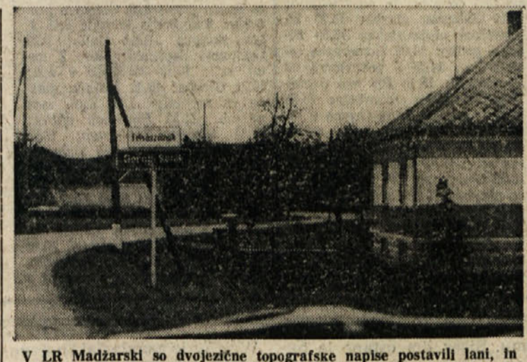
V LR Madžarski so dvojezične topografske napise postavili lani, in sicer malo po svoje; k madžarski označbi kraja so pridali tablo, ki v jeziku tam živeče narodnosti označuje naselje. Felsőözönk - Gorali Senik sodi med največje slovensko - madžarske kraje v Porabju, v njem uspešno deluje mešani pevski zbor Avgust Pavel, in sploh je ta kraj žarišče narodnostne aktivnosti med Slovenci v Železni županiji

Komisija za narodnostna vprašanja in obmejne stike pri pomurskem medobčinskem svetu SZDL se pripravlja na skupno sejo z narodnostno komisijo, ki deluje pri izvršnem svetu madžarske Železne županije. Prva taka seja je bila lani v Monostru na Madžarskem, druga pa bo predvidoma 14. marca v Lendavi.