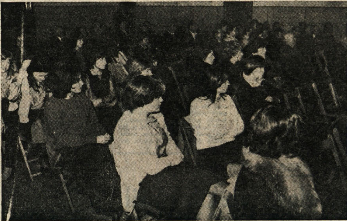
Prizor z občnega zbora PD Vesna iz Križa