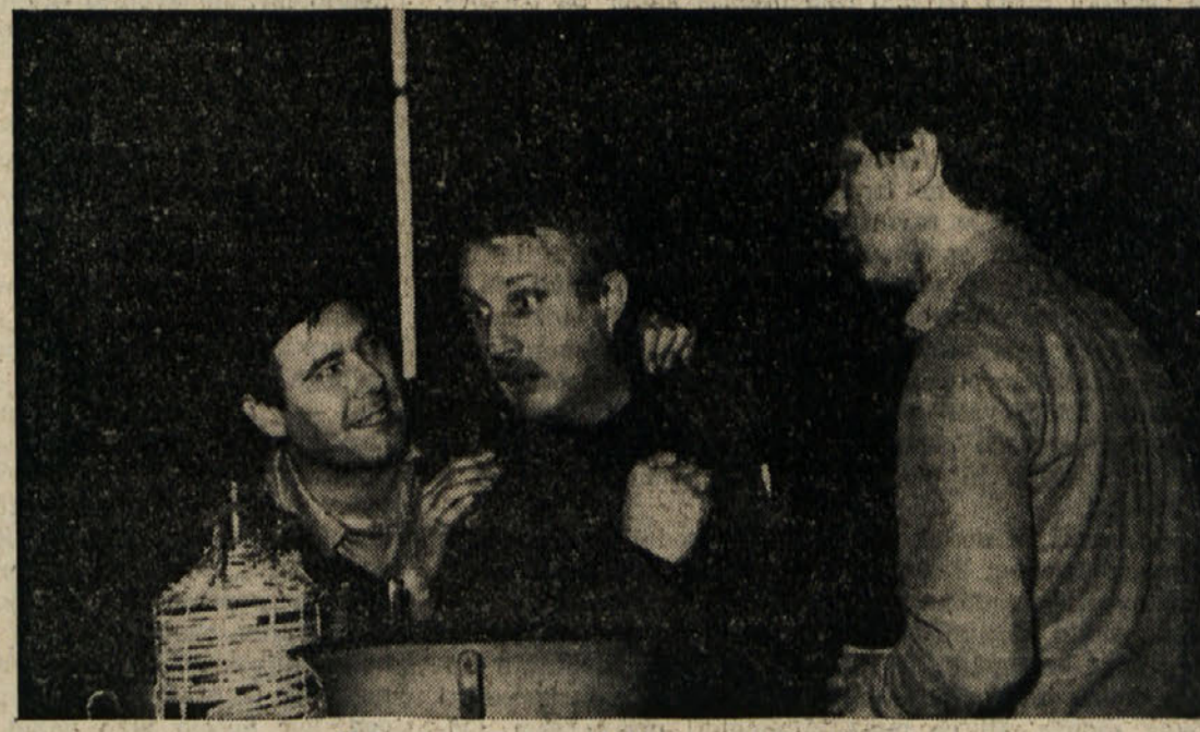
Med vajami za igro Vražji fant zahodne strani