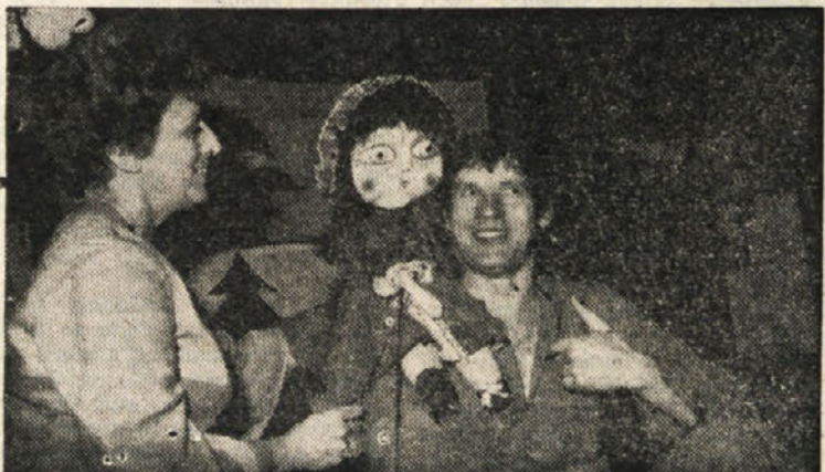
Na prvem torkovem večeru v marcu v Slovenskem klubu je nastopilo Laskovo gledališče iz Ljubljane, ki je predstavilo pravljico Mdeca kapica in Princeska na zrnu graha

Predstavitve bo v prostorih Krčka za kulturo in umetnost v Trstu, Ul. S. Carlo 2, v četrtek, 13. marca, ob 18.45.