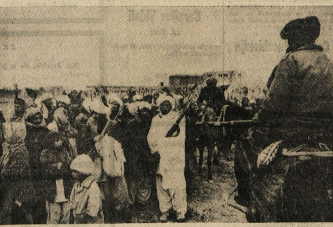
Afganistanske gverilce, ki se borijo proti Sovjetom, v marsikateri vasi sprejmejo zelo prisrčno

NOVI DELHI — Predlogi o oblikovanju mednarodne sile, ki bi zagotovila varnost afganistansko-pakistanske meje je najbolj opazna skupna točka izjav, ki prihajajo zadnje dni iz Kabula in Islambada. Afganistanski predsednik Karmal je v enem svojih zadnjih intervjujev dejal, da bi njegova vlada pozitivno reagirala na sklicanje konference, na kateri bi se domnili o oblikovanju mednarodne sile za nadzorstvo eksplozivne