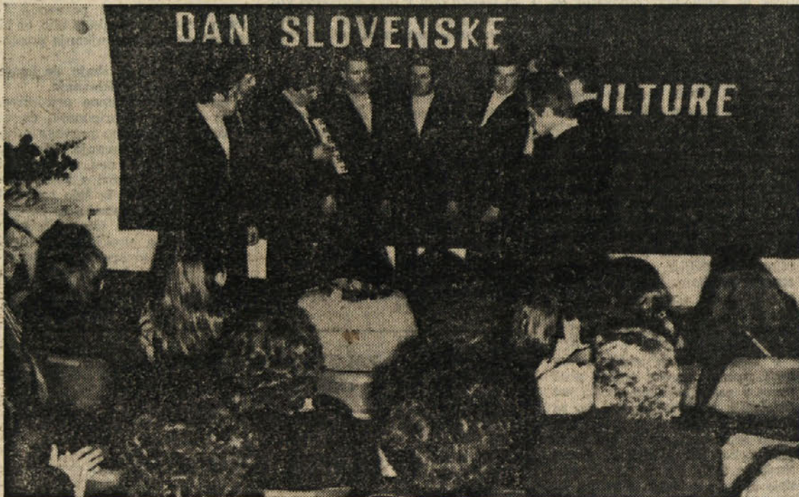
Skoraj vsa naša društva na Tržaškem in Goriškem so v preteklih tednih na takšen ali drugačen način praznovala praznik slovenske kulture. Nekatera so k praznovanju pristopila na tradicionalen in nekoliko izrabiljen način, drugod pa so se praznovanja lotili na izvrnejši in kulturno umetniško bogatejši način. Dejstvo je, da se je ob tej priložnosti izpričala precejšnja živahnost na našem kulturno prosvetnem področju. Na sliki prizor s Prešernove proslave PD Rdeča zvezda iz Saleza, kjer je nastopil tudi Sovdenjski nonet