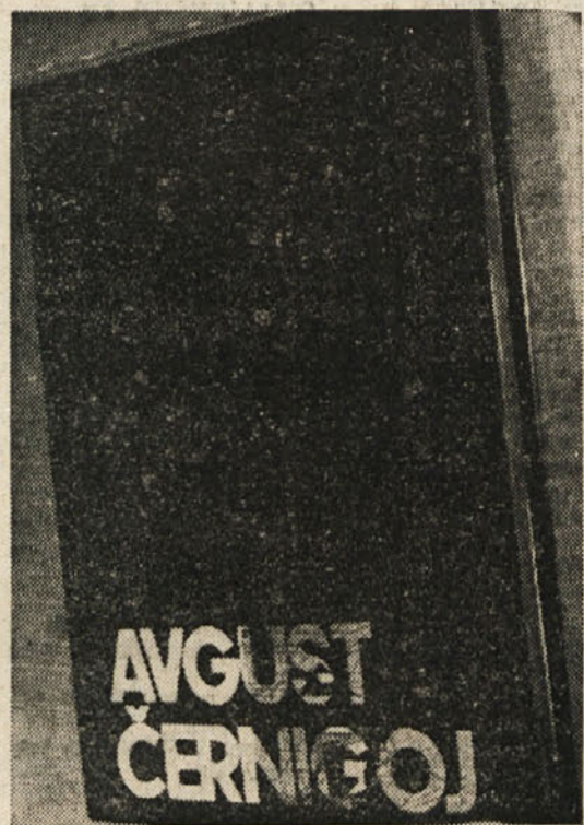
Objavljamo reprodukcijo platnice monografije o Avgustu Černigoju, ki je te dni izšla pri Založništvu tržiškega tiska v Trstu. S slikovnim gra-

divom bogato dopolnjena obravnava Černigojevega življenja in dela je sad večletnega raziskovalnega in znanstvenega dela Petra Krečiča, ravnatelja Arhitekturnega muzeja v Ljubljani. Knjiga ne samo odstra pogled na izredno raznoliko in plodno slikarsko pot Černigoja, ampak pričuje tudi o velikem slikarjevem prispevku k razvoju slovenskega slikarstva in k razgibanosti in odprtosti našega kulturnega prostora.