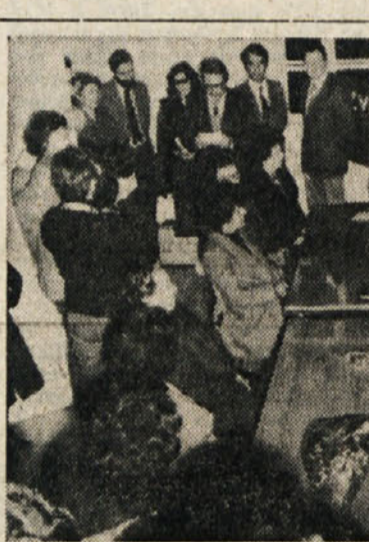
V petek so v Boljuncu odprli posvetovalnico za ženske dolinske občine

Cisto na koncu pa zapišimo še, da izdaja Državna zalozba Slovenije tudi dve pomembni slovenski reviji in sicer literarno revijo Sodobnost, ki piše letos že svoj 28. letnik, ter poljudnoznanstveno revijo Priroda, človek in zdravje, ki letos izhaja že petintrideseto leto.