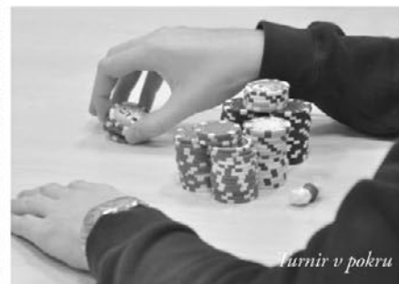
turnir v pokru

vijal po pričakovanjih, pozitivno me je presenetilo število udeležencev, saj smo jih pričakovali okoli 80 tako kot lani. Turnir je potekal izredno gladko, brez zapletov in komplikacij. Za to je poskrbela celotna ekipa ŠD Kenguru, saj nam je organizacija in potek tekmoovanja uspel zelo dobro. Spet smo pokazali, da za takšno prireditvijo ne more stati posameznik, ampak močna ekipa.«