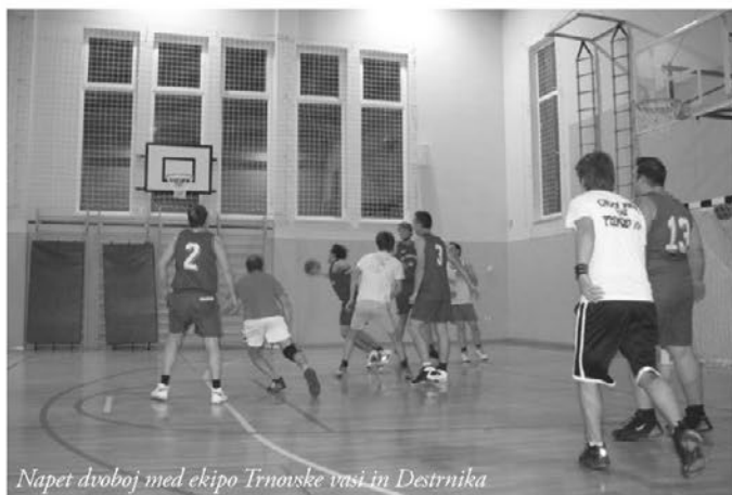
Napet dvoboj med ekipo Trnovske vasi in Destrnika

Teksti: Dušanka Škamlec