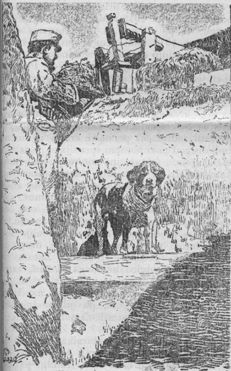
Treu Kameraden Wachhund und Beschützer gegenüber dem Feinde

Naša slika kaže avstrijskega vojaka kot pazovalno stražo s svojim psom ob zvoncu za alarmiranje. Znana zvestoba psa se je tudi v tej vojni hvalevredno obnesla.