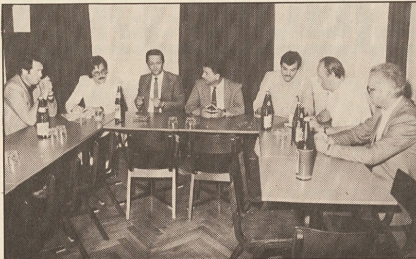
Predstavniki gospodarske zbornice Bosne in Hercegovine pri koroških Slovencih

z demagoškimi, predvsem pa s protislovenskimi parolami zvabiti volilce na led (glej zadnji NT), v bistvu prav tako ni uspela: sicer je pri občinskih volitvah pridobila nad 3%, pri pokrajinskih pa zgubila skoraj 5%. Precej uspešno so odrezali mdr. socialisti (pokrajinski svet: Več kot 3%, občinski svet - 4%). Tudi fašisti so bili uspešni (+ 1%). Volilna udeležba je bila nižja, število neveljavnih (belih) glasov pa višje kot pri zadnjih volitvah. Porazdelitev mandatov v pokrajinskem svetu: Slovenska skupnost 1, Lista za Trst 9, KPI 7, DC 6, socialisti 2, fašisti 2, socialni demokrati 1, republikanci 1, gibanje za Trst 1. Občinski svet Trst: Slovenska skupnost 1, Lista za Trst 20, DC 13, KPI 12, socialisti 5.