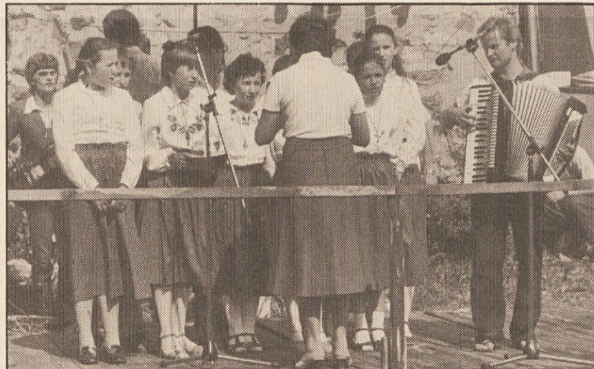
Bistriška mladina je zapela sovrstnikom

Skrb za mir je bila pri vseh pogovorih. V skupini, ki se je pogovarjala o miru, o možnostih dela in novih poteh do miru pa posebej. Zrno pogovora je, da se je treba za mir zavzeti, da je treba zanj delati, da se je treba za mir truditi. Mir ni izrecna pravica samo prebivalstva, ampak vsega človeštva in zato je treba ustvariti pogoje, v katerih bo imel možnost obstoja. Želja po miru, hrepenenje po miru je bilo mogoče razbrati tudi iz risb, ki so jih mladinci vrgli na steno v opuščnem farovškem hlevu. Te risbe so kot krik silile k premišljanju.