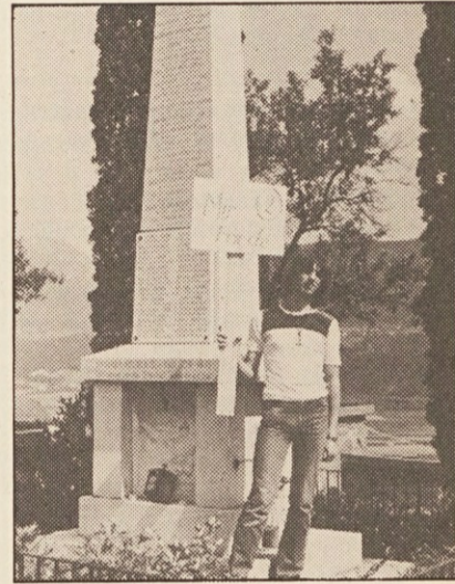
Kjer je mir, ni treba vojaških spomenikov

jup, mladinci skoraj niso hoteli pustiti raz plešišče. Na odru pod farovžem pa je potekal spored, ki je obsegal od rock-glasbe Jadagonov, plesanja, raznih skečov in smešnic obširen prikaz mladinskega dela.