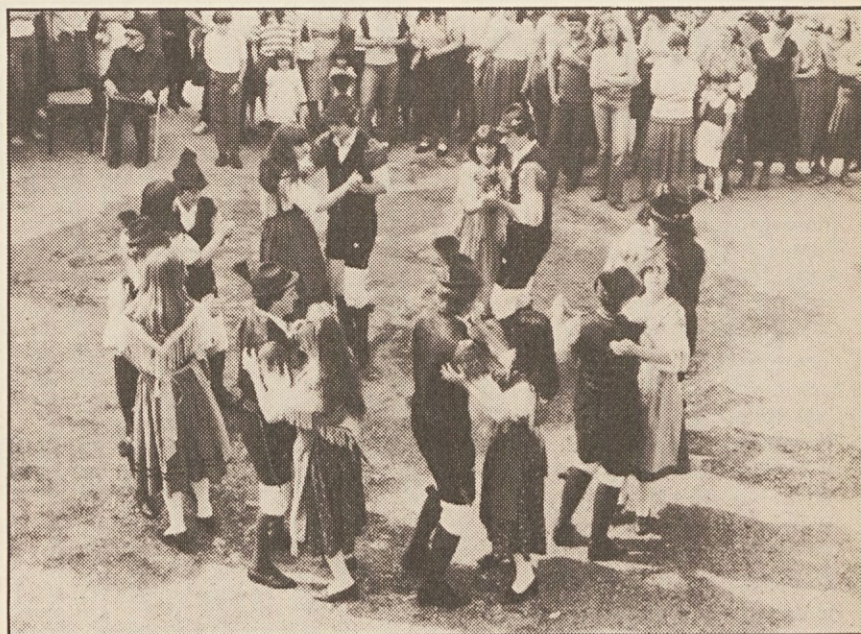
Ukljani so zastopali Kanalske Slovence