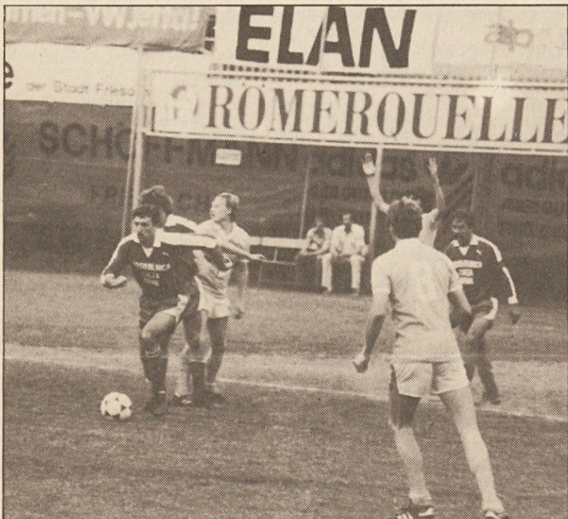
Obramba SAK se je v Brežah pokazala z najboljši strani

Tekma je bila posebno v drugem polčasu napeta in dobra, pri SAK-u pa je treba zlasti pohvaliti obrambo, ki je tokrat opravila svoje delo zelo dobro. Proti koncu tekme so domačini močno pritiskali na SAK-ova vrata, toda slovenski nogometaši so spretno ubranili vse napade in tako zaslužno dosegli prvo točko v igrednega kola na tujem. Vsekakor rezultat 0:0 odgovarja poteku igre, ki jo je dobro vodil sodnik Glanz.