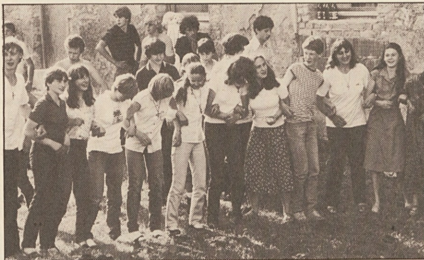
Skupinski plesi so še bolj povezali mladino