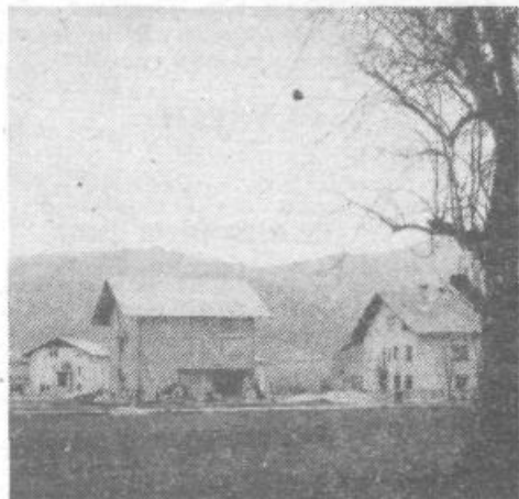
Zeje (na sliki) in Žulova vas pa sta naselji v krajevni skupnosti Kozarje, ki bi potrebovali redno oskrbo s pitno vodo. Tudi za rešitev tega problema imajo Kozarčani pripravljen predlog

Na zboru krajanov so se hoteli nekateri podpisati na listo prisotnih in s tem izreči za kanalizacijo. Ker pa tam niso bili vsi krajski, vsi pa težko pričakujemo kanalizacijo, menim, da bo referendum uspel in, da bomo lahko uresničili največji projekt naslednjega srednjeročnega obdobja.