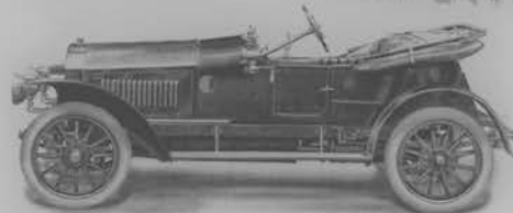
Vierzylinder, Type B, 5/23 HP, mit reinerzigter Sportkarosserie.