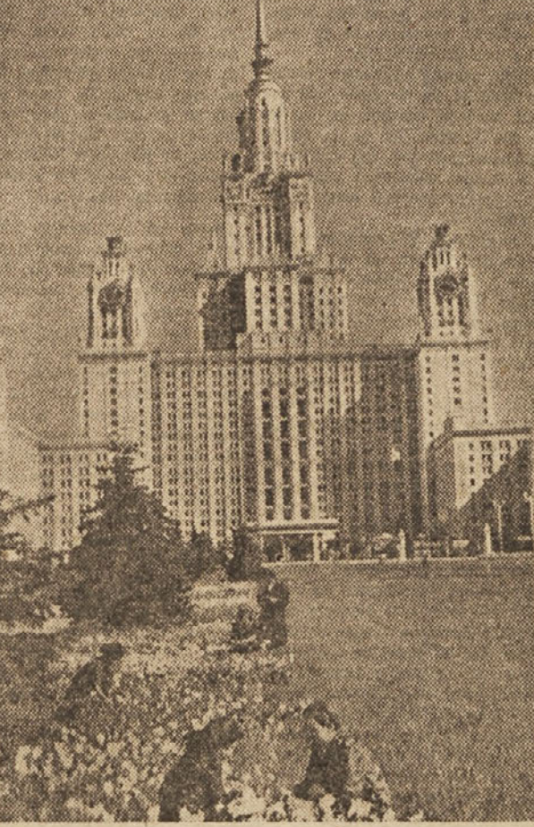
Poslopje moskovske univerze na Leninovih gorah