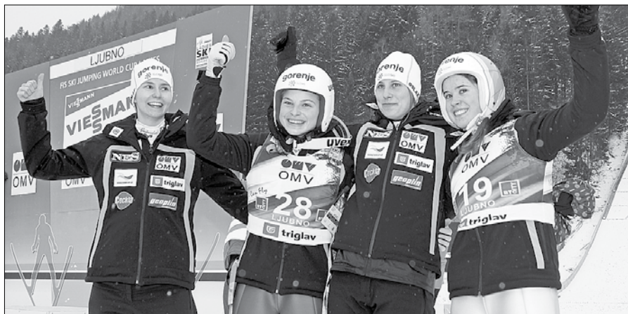
Vražje Slovenke so vedno navdušene nad občinstvom na Ljubnem ob Savinji.