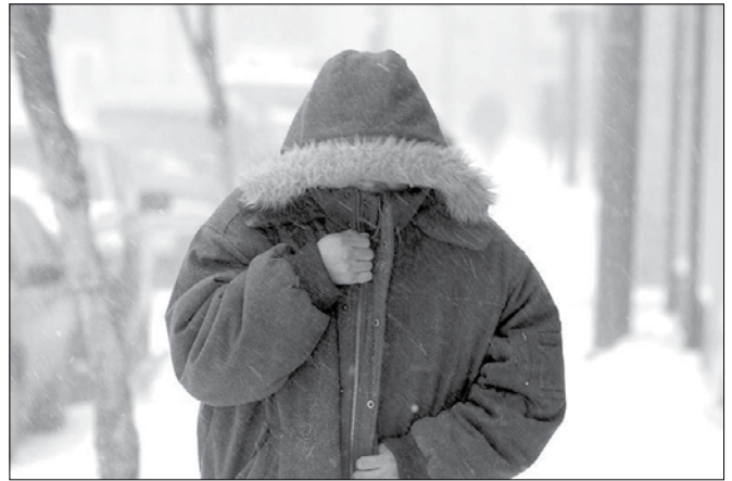
Obilne snežne padavine so bile na jugu države, v naši dolini je zapadlo bore malo novega snega, pospremljenega z močnejšim severnikom.