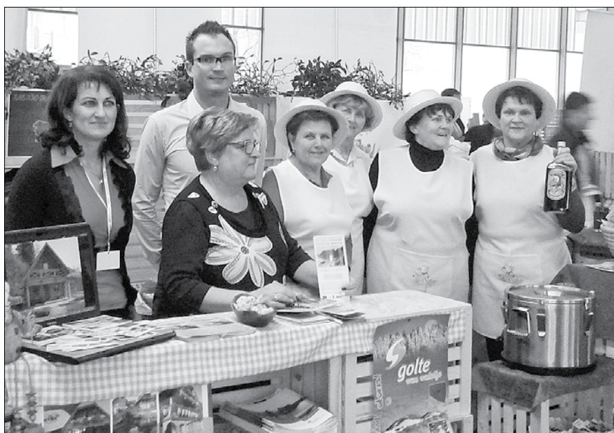
Člani Turističnega društva Mozirje so na sejm predstavili ponudbo svoje občine. Zeliščarke iz društva upokoencev pa so poskrbele za dodatno ponudbo in dogajanje, ki je obiskovalce privabljal na njihovo stojnico.