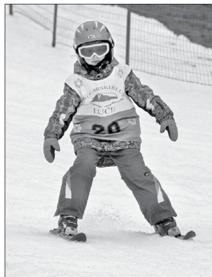
Še malo in bom zmagala ter dobila medaljo kot Tina Maze.

Na zasneženem pobočju smučišča v Logu v Lučah je predzadnjo januarsko soboto potekala veleslalomski tekma. Udeležili so se je najmlajši udeleženci smučarskega tečaja, za katerega so poskrbeli člani Smučarskega kluba Luče. V letošnji zimi so izvedli dva smučarska tečaja, ki se ju je udeležilo 50 otrok. Trinajst začetnikov in enajst tečajnikov nadaljevalnega tečaja pa se je udeležilo smučarske tekme.