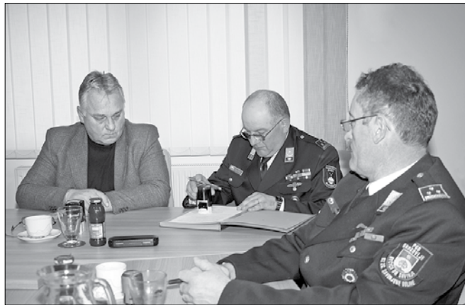
Podpis aneksa k tripartitni pogodbi o izvajanju gasilske javne službe in financiranju dejavnosti zgornjesavinjske gasilske zveze

Župan je v uvodnem nagovoru predstavil negotovo finančno stanje občin, saj v tistem trenutku še ni bila znana višina sredstev, ki jih bo država letos namenila za delovanje lokalnih skupnosti. Kljub temu so v občinskem proračunu za delovanje gasilske službe nameni-