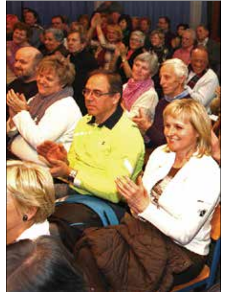
Navdušeni poslušalci na pevskem recitalu

PODELITEV PRIZNANJ ZA NAJ OSEBNOSTI OBČIN ZGORNJE SAVINJSKE DOLINE LETA 2014