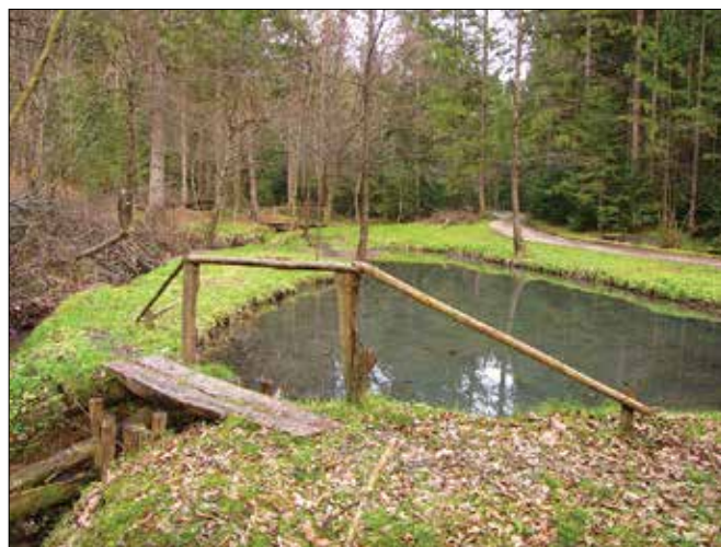
Žabjeki v Blatah so preplet mokrišča naravnega in umetnega izvora.

kovo jezero nad Lučami in Biba na Menini. Čreta pri Kokarjah je dobila ime po čreti, močvirnem svetu, ki je značilen za ta predel. V Blatah