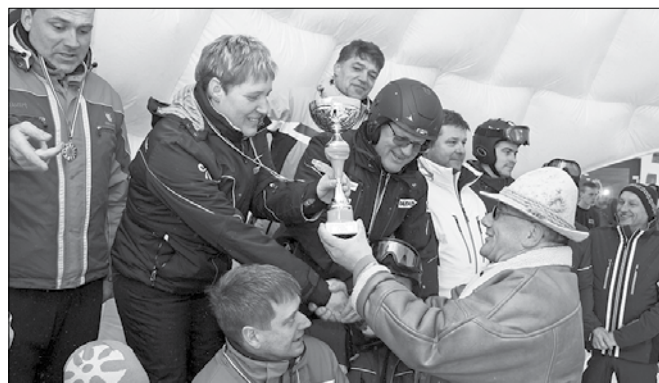
Ne le Škalčani, na Golteh so zmagali vsi gasilci, ki so nastopili v težkih vremenskih pogojih.