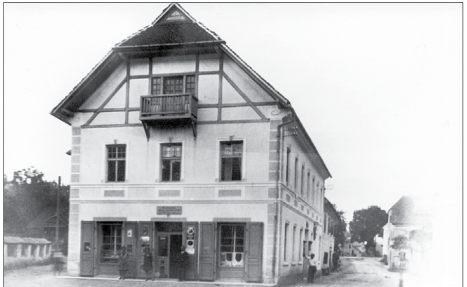
Hiša konzuma v Mozirju je Kmečka posojilnica zgradila pred prvo svetovno vojno. V njej je imela tudi sedež.

Neustrašeni naši predborci Čehi so prvi razglasili svojo svobodno republiko. Naš troimenški narod Slovencev, Hrvatov in Srbov se je združil v svobodno državo SHS. Na predvečer narodnega praznika pokali so zopet topiči in donel je glas: »Živela republika!« Vse hiše so bile v zastavah, zvečer pa sijajna razsvetljava in obhod, vriski in radost povsod. Pod lipo je bil improviziran govorniški oder, s katerega so govorniki v gromoglasnih besedah označili razkroj in razpad gnile Avstrije.