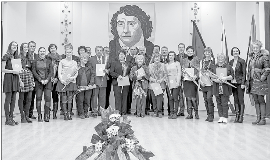
Prejemniki območnih priznanj za kulturno delovanje