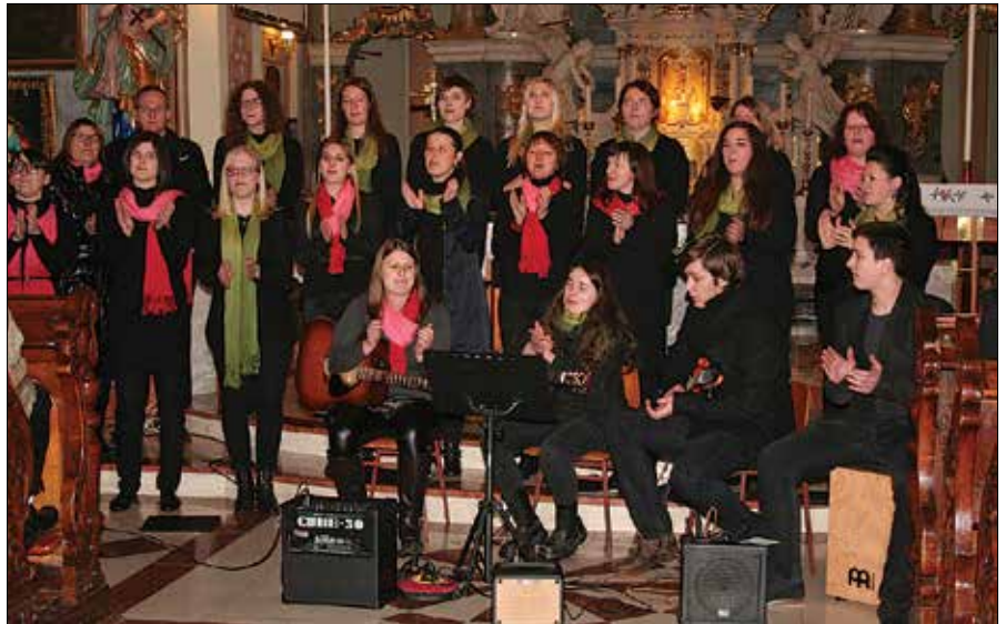
Ob tokratni priložnosti so pevci v svojo sredo povabili bivše člane in članice, ki ne prepevajo več z njimi.