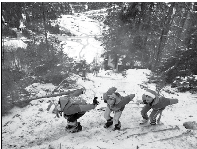
Po tekmovalnem delu mini pokala Vitranc je sledila še sprostitve z vzponom na vrh planiške velikanke.