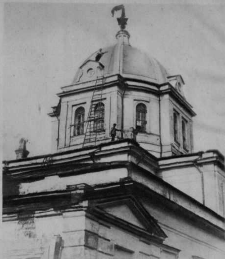
Ruski boljševiki v svojem sovraštvu do vere uporabljajo cerkve za dvorane, skladišča i. t. d. Slika nam kaže, kako so pravkar z vrha cerkve sneli križ ter nataknil na njegovo mesto rdečo zastavo. Stara zgodba v vseh onih deželah, kjer se katoličani ne brigajo za javno življenje ali volijo v državne zборе svobodomislece namesto prepričanih katoličanov.