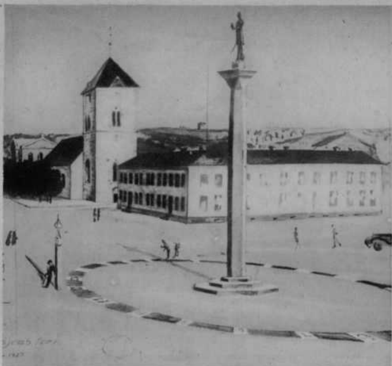
Največja solnčna ura v norveškem mestu Dronthjem. Kip nekega starega kralja na visokem tankem podstavu kaže s svojo senco ure, ki so v velikem krogu napisane na tleh obširnega trga.