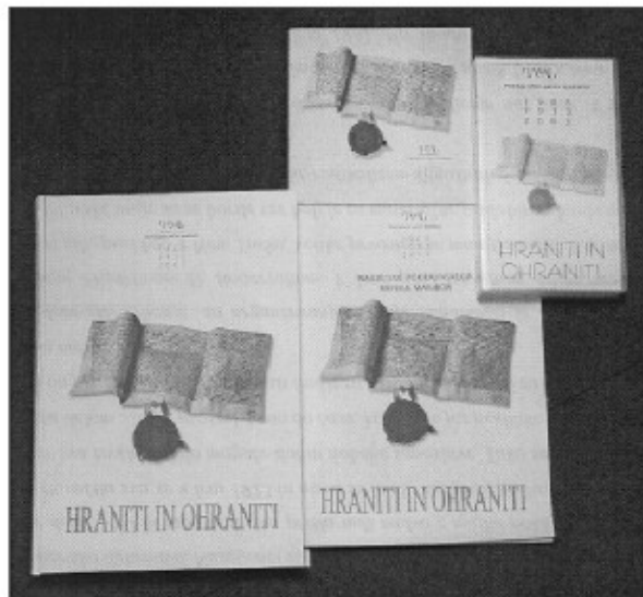
Jubilejne publikacije Pokrajinskega arhiva Maribor