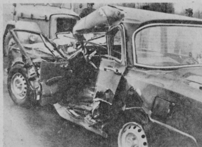
Po izrednem naključju je človek v teh razbitinah preživel. Vprašajmo se, kaj je storil sam in kaj smo storili mi, da do nesreče ne bi prišlo?

Delegati na zadnji seji SO Ormož so tudi ugotavljali, da ni miličniške kontrole na stranskih cestah in da se tam dogaja „prometno „čudo“ z mopedi in drugimi motornimi vozili. Povedali smo že, da ni ljudi na PM pa tudi tehnični pripomočki so slabi, zato bomo vsi „miličniki v malem“. Kdor ve, kaj je prav in kaj ne, in komur ni vseeno, kaj se v naši družbi dogaja, naj opozori svojega sosedo, znanca itd. kaj je red in disciplina. Pri tem se seveda v praksi čisto dogaja, da bi radi imeli red in varnost, pri tem nedotakljivost tistih, ki predpise kršijo. To je boj med dvema ognjema, ki mu ni konca in je v njem nemogoče delati.