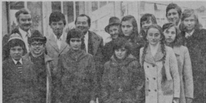
Ptujski delegati pred potjo v Celje. Avtorica sestavka šesta z desne (zadaj).

Drugo jutro ob osmih bi si morali ogledati „celjski pisker“ in rimske izkopenine v Šempetru, nato pa bi se odpeljali na Golte, vendar jih je odpeljal po nespornazumu šofer avtobusa naravnost na Golte.