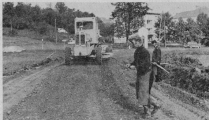
V Leskovcu gradijo asfaltno cesto