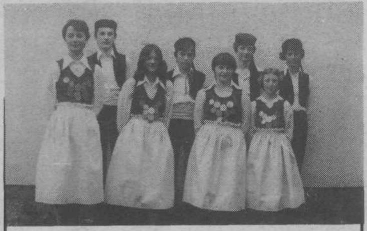
OŠ Karla Destovnika-Kajuha je v letu dni naštudirala več plesov, s katerimi je nastopala na šolskih prireditvah in za širšo javnost. Na sliki: skupina je pripravljena za hercegovski ples na melodijo iz opere Ero z onega sveta.