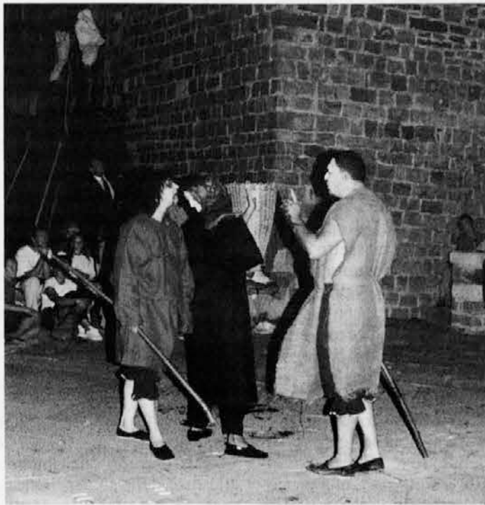
Med predstavo na gradu Sv. Justa v Trstu

Namen Scramsaxa, kot je jasno zapisano v statutu, je spodbujati razvoj in sirjenje kulture in gledališke tehnike s posebnim poudarkom na lik igrač, commedia dell'arte in klovna ter raziskovati