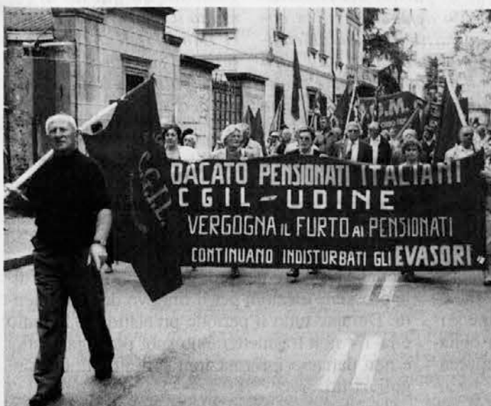
Uno scorcio della manifestazione di Udine

Quasi tremila persone hanno preso parte martedì mattina, ad Udine, alla manifestazione di protesta dei lavoratori svoltasi contemporaneamente anche negli altri centri della regione, contro la manovra economica decisa dal governo Amato.