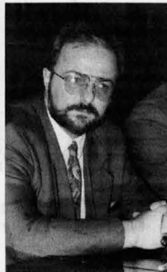
Minister Borut Šuklje

Srečanje je bilo seveda tudi priložnost, da je vodstvo Zveze predstavilo ministru Šukljetu delovanje, pomen in vlogo, ki jo ima ZSKD v okviru manjšinske skupnosti in v sirsi italijanski civilni družbi. Podrobno sliko o organizaciji, ki na