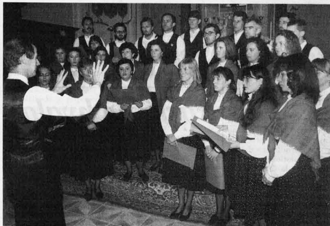
Za dvajsetletnico Studijskega centra Nediža je v petek zapel pevski zbor Pod lipo

Ne gre pozabiti, da bodočnost gospodarske stvarnosti od Nove Gorice do Tolmina in Bovca je v dobršni meri odvisna prav od omenjene avtocestne povezave. Od nje je odvisno tudi pospešeno gospodarsko sodelovanje vzdolž meje in del samega načrta sodelovanja med Slovenijo in Furlanijo-Julijsko krajino. (R.P.)