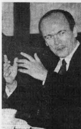
Predsednik Janez Drnovšek

V ta proces sodi tudi dogovarjanje s sosedi. V kratkem naj bi prislo do srečanja med premierjem Janezom Drnovškom in zastopniki hrvaske vlade, do konca leta pa naj bi se Drnov-