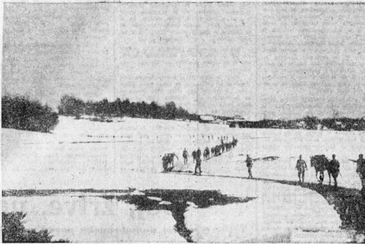
Immer dem Feinde nach — Neprenehoma za sovražnikom domovino.

Odbor je sam delil podpore v obliki, obitvi in stanovanju. Pisarna je v stalni zvezi s Socialno pomočjo, škofljsko dobrodelno pisarno in Pokrajinskim podporam