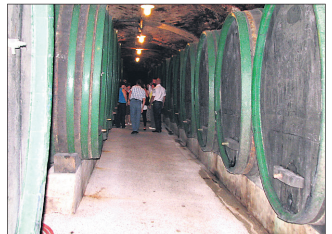
Ptujška klet z vini Pullus poskuša osvojiti čim večji tržni delež tudi v tujini, še vedno pa je najbolj prodajano vino Haložan. Količinske so zaloge, pa ostaja skrivnost, saj po besedah direktorja velja staro pravilo, da se po sodih ne sme trkati ...

Slovenija, Podravje • Nova bolezen živali se širi