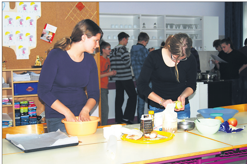
V kulinarični delavnici so učenci pripravljali dobrote po slovaških receptih.