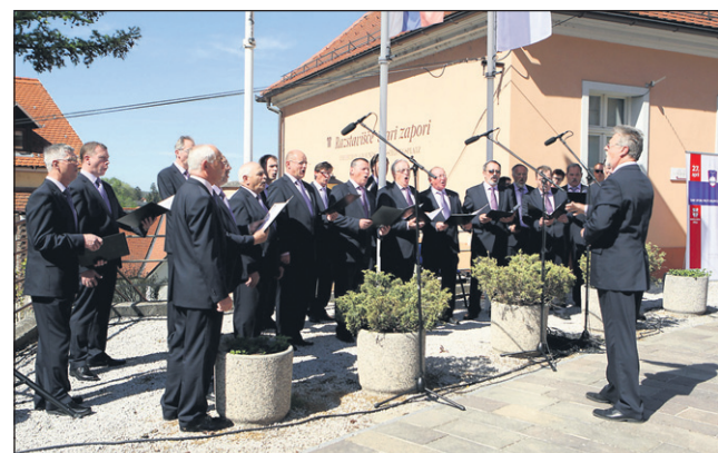
V kulturnem programu so sodelovali Pihalni orkester Ptuj, Moški pevski zbor KUD Rogoznica (Ptuj) in člani Gledališkega studia Ptuj v sodelovanju z Gimnazijo Ptuj.