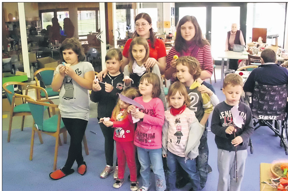
Otroci smo ob stavki preživeli prijeten dan v Domu upokojencev Ptuj.