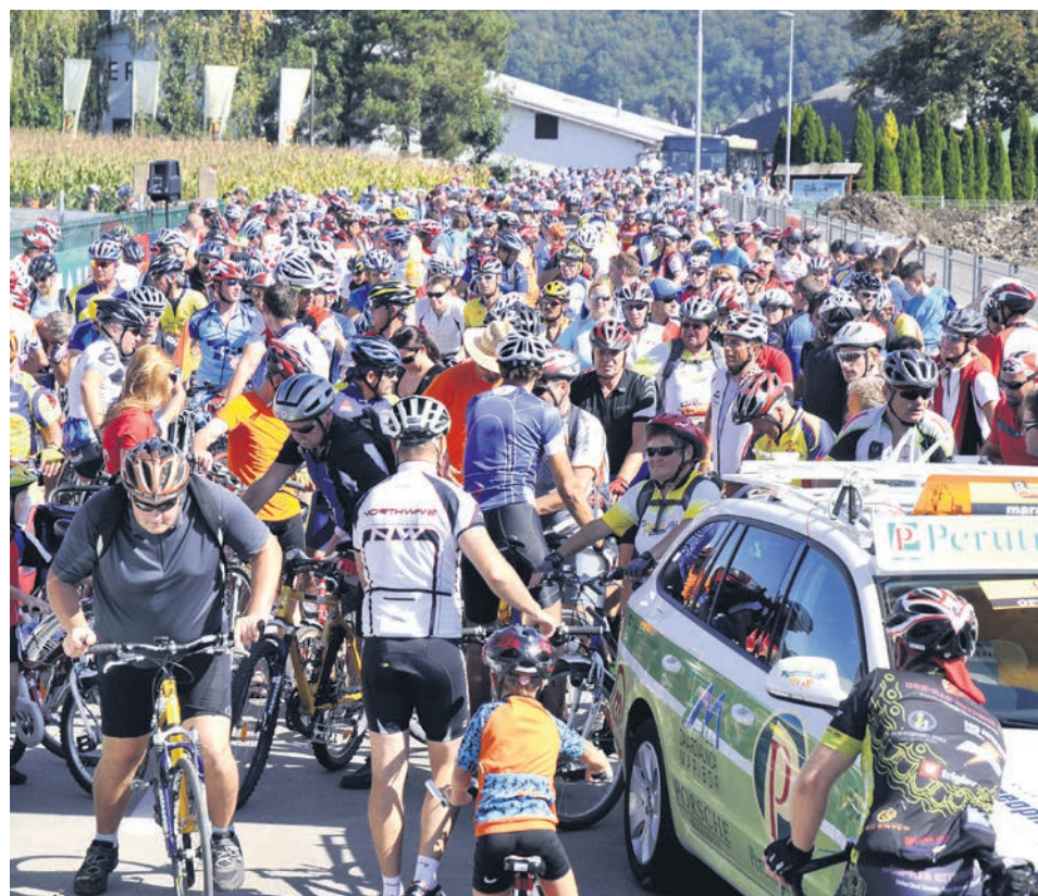
Bodite tudi vi v družbi kolesarjev 10. Poli maratona. Vse dodatne informacije dobite na www.polimaratonsi.si .

Vse je torej že pripravljeno, manjkate le še vi. Pred prijave na 10. Poli maraton zbiramo na spletni strani www.polimaratonsi.si , prijave bodo mogoče v tednu