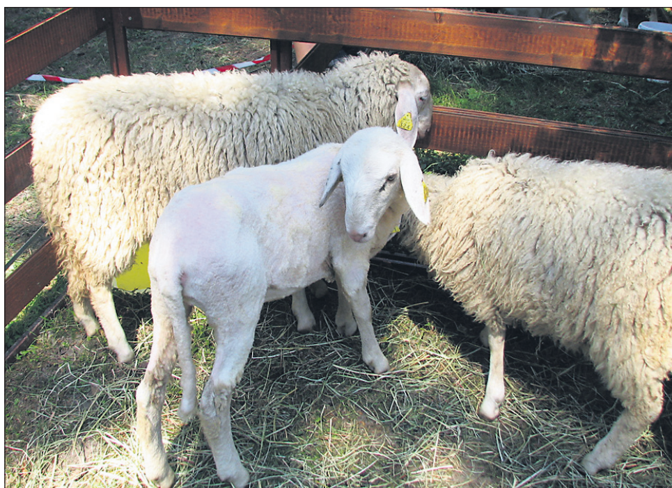
V čredah drobnice na kmetijah v zahodnoevropskih državah se je pojavila nova bolezen: virus schmallenberg, ki bi se s prihodom poletja in insekti lahko začel širiti.

Iz izjave Stalnega odbora za prehransko verigo v EU je