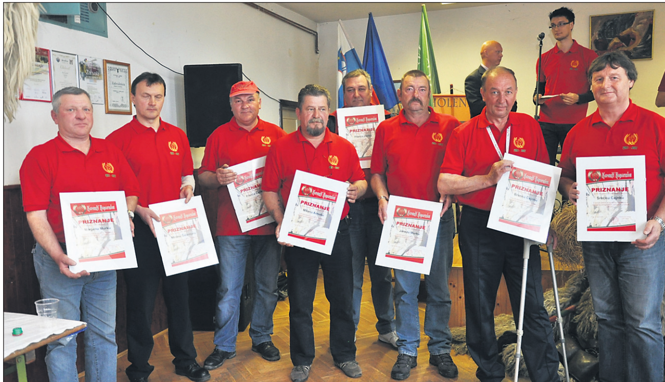
Prejemniki priznanj za tridesetletno delo v sekciji

Prireditev se je začela z uvodnim filmom, na katerem so bili prikazani domači koranti ob koncu osemdesetih let. Nato so vse goste – zbralo se jih je čez 150 – pozdravili koranti s svojim zvonjenjem. Sledil je slavnostni nagovor predsednika sekcije Koran-