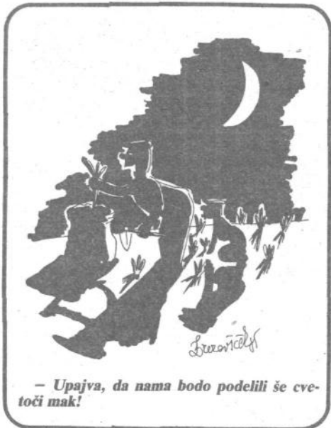
– Upajva, da nama bodo podelili še cvetoči mak!

Zdaj so sklenili, da bodo temu naredili konec. Kako? Po 10 do 15 sosednjih vrtičkarjev se je združilo v samoupravne vrtičkarske enote. Te se prav sedaj dogovarjajo, kako bi pospravili svoje vrtnice tako, da bi ne vzbujali neprijetnih občutkov mimoidočih. Tako bodo fižolnice, sode in drugo vrtičkarsko opremo pospravili na enoten način. Ne bodo jih več pokrivali za zimsko zaščito s kričnimi polivinili, temveč le z brezbarvnimi (prosojnimi) ali temnimi polivinilom itd.