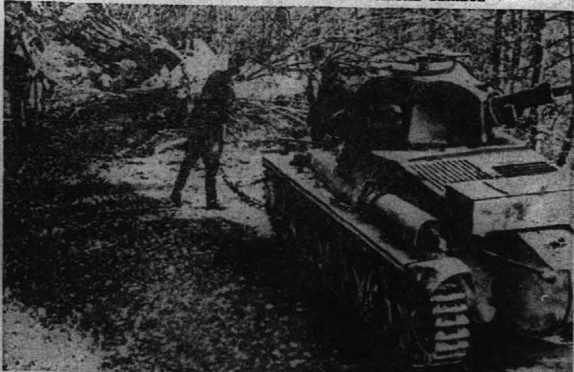
Gerilci v Jugoslaviji povzročajo Nemcem take preglavice, da se vojaške patrulje ne upajo več iste zasledovati po gozdovih. Le zavarovani s tanki se še upajo v gozdove, drugače ne. Zadnja poročila omenjajo, da nsprestani napadi na nemške čete v Jugoslaviji so silno zrahjali morale nemških čet.