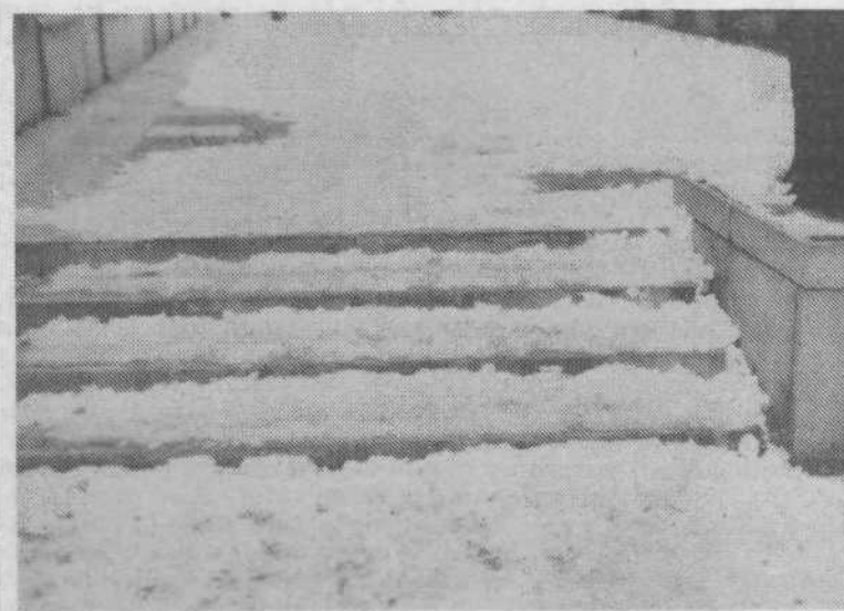
Stopnice pred Maximarketom so bile dobesedno »neprehodne«. Ker je taka »drsalnica« v polmraku umetne razsvetljave ponoči nevidna in popolnoma presenetel pešca je bilo med zlomljenimi nogami na kliničnem centru tudi nemalo izvrstnih »trimašev« vseh starosti.