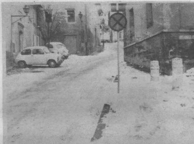
Vsekakor v »veselje« in nevarnost otrok. Klanec je bil neposut ves teden.