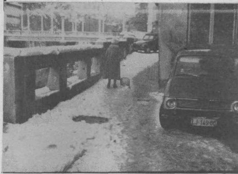
Za starejše gospodinje je bila vsakdanja hoja na trg prava pustolovščina.

Do nedavne odjuge so bili ljubljanski pločniki bolj podobni drsališču, kot pa pešpotem. To se je odsevalo tudi na urgentnem oddelku kliničnega centra, kjer so zabeležili rekordno število zlomov kosti. Res je, da ni vedno dovolj denarja, da bi komunalno podjetje ročno razbijalo led po pločnikih, res pa je tudi, da bi v takih izrednih situacijah (tako kot v Mariboru) komunalnemu podjetju priskočili na pomoč mladinci.