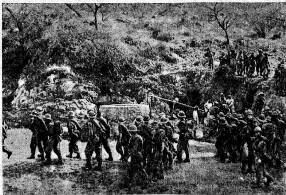
Italijanski pionirji pri delu na albanskem bojišču

boje Hrvatov za osvobojenje. Avtor dr. Milivoj Popović poudarja veliko moč v zajednici v skupni državni tvorbi iz svobodne volje Srbov, Hrvatov in Slovencev. V tem članku ni besed, ki so nas včasih žalile. V članku ni negiranja treh individualnosti in kar najbolje deluje, je ugotovitev, da Srbija v svetovni vojni ni misljala na materialno eksploatacijo ne na hegemonijo pa tudi ne na to ali ono državno ureditev. Srbija predstavlja za nas v prvi vrsti srbskega kmeta, on se je v glavnem boril in umiral, zato smo prepričani, da je bil on daleč od hegemonije. Hotel je rešiti svojo domovino ter jo okrepiti z združitvijo domovine Hrvatov in Slovencev. Ta misel je tudi vodila Hrvate in Slovence, ko so se s Srbi zedinili v skupno državo,« ugotavlja »Hrvatski Dnevnik«.