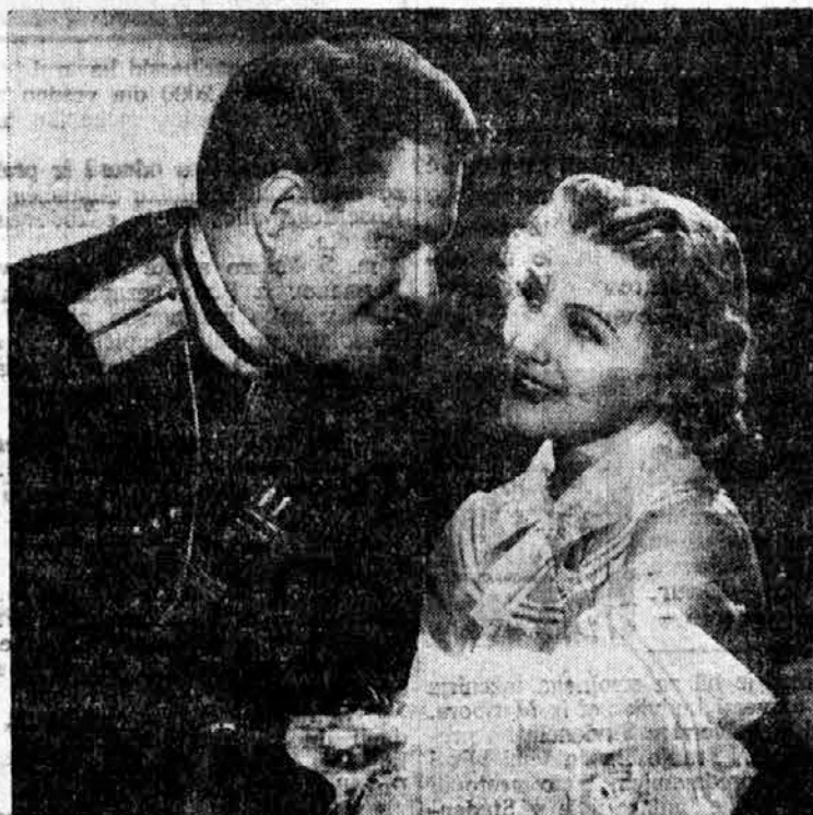
NELSON EDDY IN ILONA MASSEY V FILMU „BALALAJKA“ (MGM)

Predsednik USA je nedavno sprejel filmsko ljubljeno vsega sveta Shirley Temple v Beli hiši v Washingtonu. Roosevelt ima mnogoštevilno družino, v kateri je tudi mnogo mladih članov. Zato je priredil zanje predvajanje najnovejšega filma male Shirley Temple »Sinja ptica«. Povabil je tudi malo umetnico iz Hollywooda. »Sinja ptica« je dvajseti film zvezdnice in poleg tega tudi njen največji triumf.