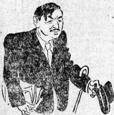
podpredsednik francoske vlade

je zagotovilo boljše bodočnosti balkanskih narodov,« naglašajo bolgarski listi. »Sodelovanje Bolgarije in Jugoslavije predstavlja brez dvoma element za razbistritev ozračja na Balkanu«, dostavlja sofijski »Večer«.