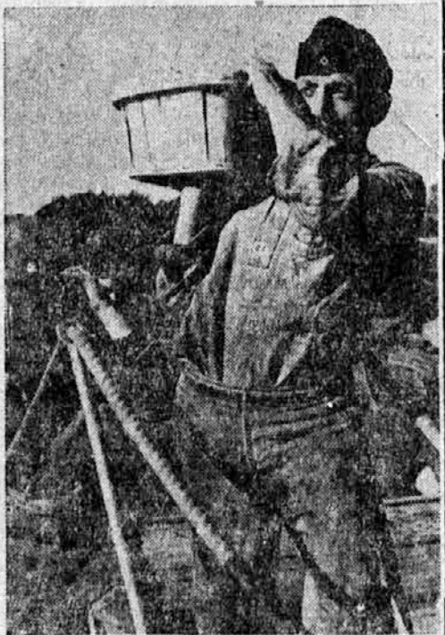
Na fronti se vojaki pečajo z nešteti opravili. Posebno dobro se godi pomočnikom kuharjev.

ki leži ob reki Osumi. V prejšnjih vekovih je bil Berat mogočna trdnjava beneških dožev. Kasneje pa se je mesto razvilo na obeh bregovih reke. Posamezna predmestja, ki so nekoliko odmaknjena od reke, pa tonejo v zelenju lepih vrtov. Nekdaj je bilo mesto zgneto samo okoli trdnjave ter je bilo važno središče pravoslavljnih Albancev. V mestu so še danes mogočni beneški zidovi s strelskimi linami. V starem delu mesta so ozke in ne kdo ve kako čiste ulice, dočim rase na periferiji novi del mesta z ličnimi vilami in stanovanjskimi hišami. Ulice v starem mestu so tako ozke, da skoz nje ne more niti navaden voz. V teh ozkih ulicah je nad trideset pravoslavljnih cerkvic in kapelic, ki so zgrajene v bizantinskem stilu. Večina cerkva ju opuščenih ter jih neusmiljeno gloda zob časa. Izredno lepa pa je beratska katedrala, ki naravnost blešči v razkošju, zlasti dragocene so starinske ikone, delo albanskih narodnih umetnikov-samoukov. Berat je sicer majhno mesto ter šteje jedva 10.000 prebivalcev. Večino tvorijo pravoslavni Albanci, precej pa je