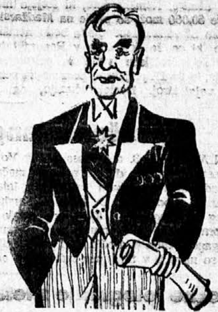
CORDELL HULL zunanj minister USA

WASHINGTON, 3. dec. Reuter. Bančni odbor senata je skupaj s finančnim odborom predstavnikega doma odobril sklep vlade o kreditu 100 milijonov dolarjev Čangkajškovi vladi. Finančni mi-