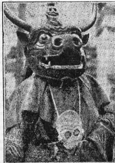
Plesalec z masko dobrega duha