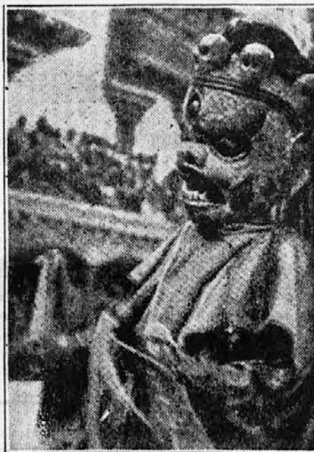
Plesalec z masko hudobnega duha

Zaradi primerjave z današnjo avtomobilsko brzino, citiramo iz kataloga stare avtomobilske znamke Panhard sledeče navodilo, ki naj se ga drže vsi lastniki avtomobilov. »Hitrost! Vozovi imajo tri brzine: majhno, srednjo in veliko. Velika hitrost se navadno določa na 17 km na uro. Po ravnini lahko voziš tudi hitreje, a nikdar več kot 20 km na uro. Ta visoka brzina zahteva silne previdnosti in ni preveč priporočljiva.«