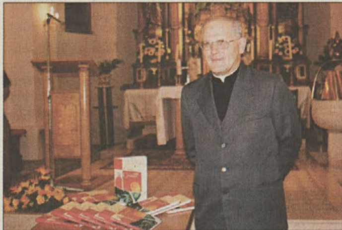
Čateški župnik s svojim knjižnim prvencem