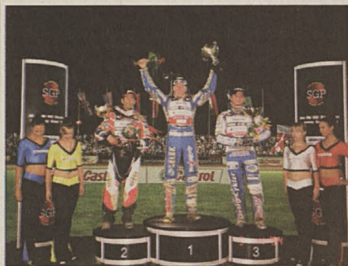
Greg Hancock, Tony Rickardsson in Hans Andersen

Dobova - Kolesarski maraton po vaseh dobovske krajevne skupnosti je vsako leto bolj množičen. Mladi, stari, dojenčki, upokojeanci, kreativci, amaterji, moški, ženske, domačini, gosti iz Krškega, Šentjurja, Šentjermeja, Črnomlja, vseh j se je zbralo rekordnih 115. Na startu v Dobovi so jim organizatorji podelili torbice okoli pasu ali kape z napisom "5. kolesarski maraton", nato pa so skupaj odpeljali 20 km. Pot jim je hitro minila; najprej so se ustavili v Rigoncah, nato pri vodnjaku na Malem Obrežu, za konec pa še pri moščanskem brodu in kovačiji Gerjevič v Selah. Po prihodu v cilj so prijetno druženje še nadaljevali pri Gasilskem domu v Selah. Udeleženci so bili nad maratonom navdušeni, tudi gosti so povedali, da je bila zanje to prva tovrstna izkušnja, ko so se prijetno družili, pa še za zdravje so poskrbeli.