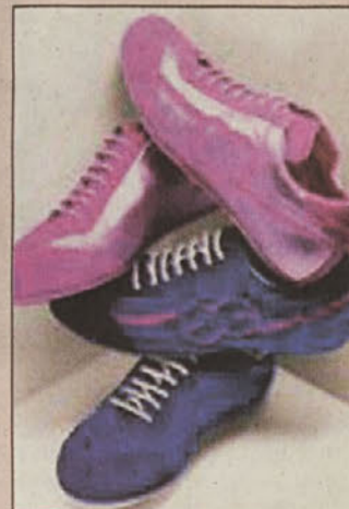
Lea Šinko Štraus