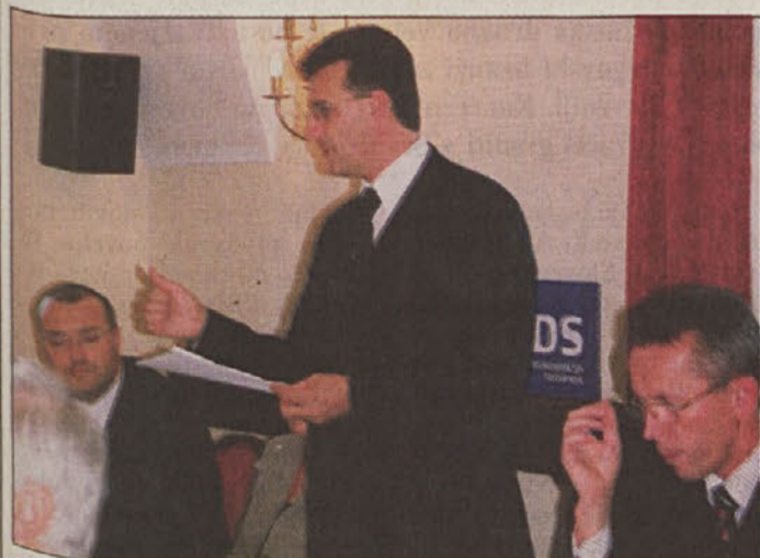
Minister za evropske zadeve Milan M. Cvikl

ti bo potrebno v znanje in tudi v infrastrukturo. Dobre povezave so namreč pogoj za uspešnost. Najbolj naraven vstop v Slovenijo je po mnenju ministra Cvikla skozi Dravsko dolino in če bi naredili povezavo s Krškimi, bi bila to najkrajša in najhitrejša pot do Zagreba.