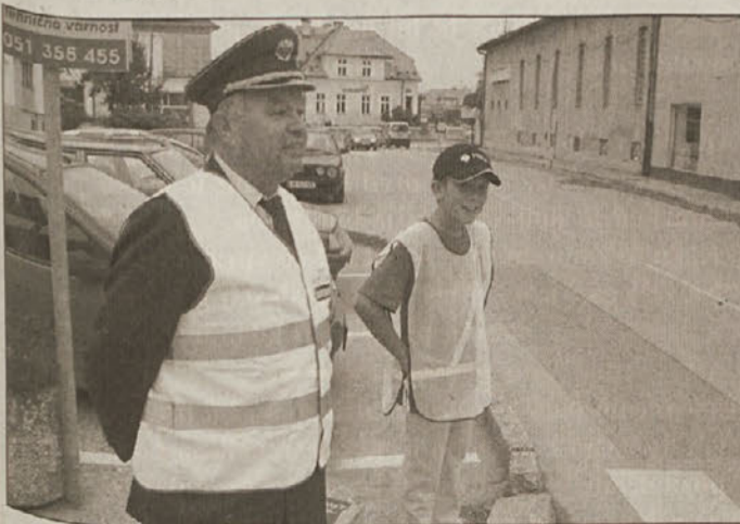
Učencem-prometnik skupaj s članom ZŠAM v akciji

Poleg samega usmerjanja prometa se članom ZŠAM Brežice zdi posebej pomembno, da svoja opažanja na cesti v prvih dneh novega šolskega leta na koncu akcije zberejo in jih kot splošne ugotovitve in prometne posebnosti po različnih lokacijah posredujejo odgovornim za to področje v občini. Splošna ugotovitev je, da prisotnost članov ZŠAM umiri promet in da so vozniki bolj pozorni na dogajanja v križiščih, s tem pa se povečana varnost na cesti, saj pogosto opažajo neupoštevanje cestno prometnih predpisov. Pomembno je tudi slabo vidni in označeni nekateri prehodi za pešce v bližini šol, ki so lahko vzrok za potencialno nevarnost. Zato bi bilo potrebno pred začetkom šolskega leta posebno pozornost nameniti obnovitvi talnih označb. Premalo je tudi obvestil voznikom o začetku šolskega leta in zato povečani nevarnosti zaradi otrok na cesti. Potrebni bi bili postaviti več posebnih trikotnikov z napisi, ki bi opozarjali na začetek šolskega leta in prisotnost otrok na cestah v bližini šol.