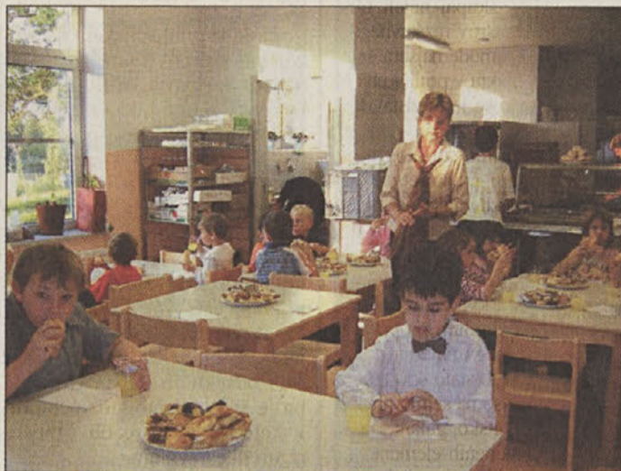
Najmlajši "člani" nove šole so se v novi jedilnici počutili kot kralji.