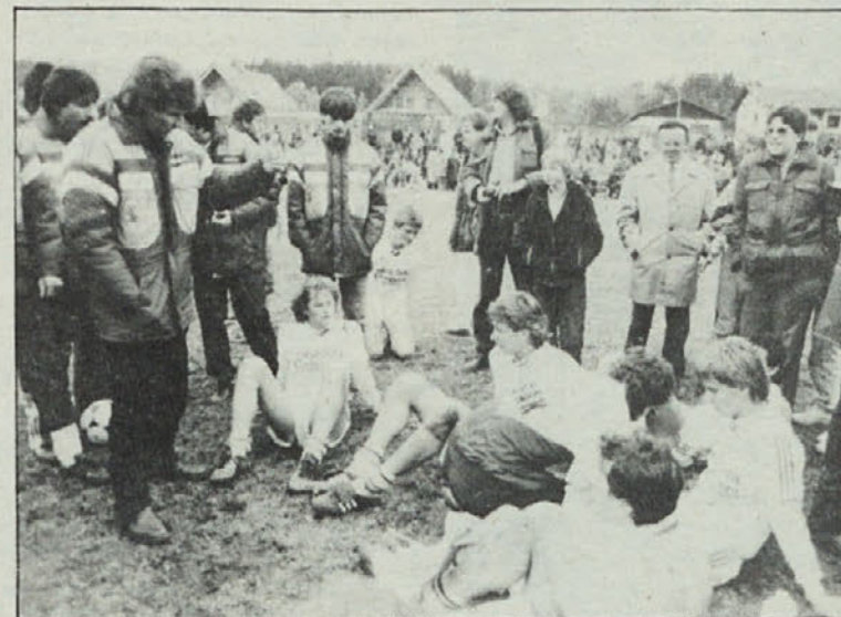
V odmoru pred podaljškom so se igralci SAK še kratko odpočili, nato pa je še enkrat sledil veliki nastop slovenskih nogometašev.