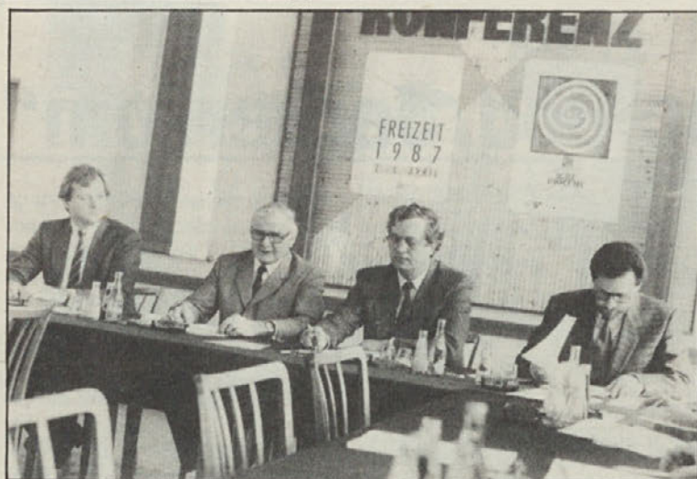
Tiskovna konferenca „Freizeit 1987“

Tik pred začetkom sejma „Prosti čas/Freizeit“ je celovško sejmišče tudi gradbišče. V veliki dvorani postavljajo nove tribune, kjer pa je zabavišče, bojo areal uredili primerno za parkirišča. Stroški 15 milijonov šillingov.