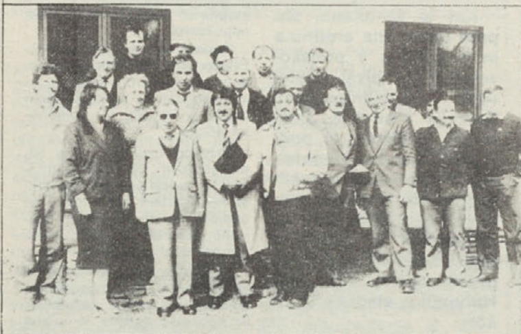
Udeleženci seminarja pri Karglnu v Bačah

Po dolgem je Klub slovenskih občinskih odbornikov (KSOO) priredil spet za naše občinske odbornike in njihove namestnike šolanje.