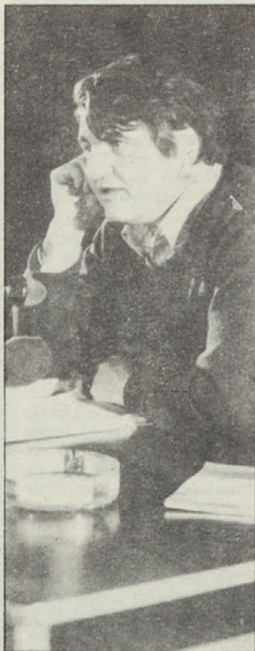
Peter Turrini je bral na začetku mladinskega festivala.