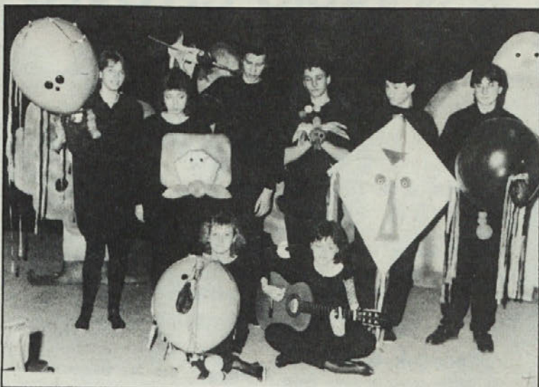
Šmihelski lutkarji so imeli preteklo nedeljo dopoldne premiero komada „Nebesno gledališče — igra za oblake“.