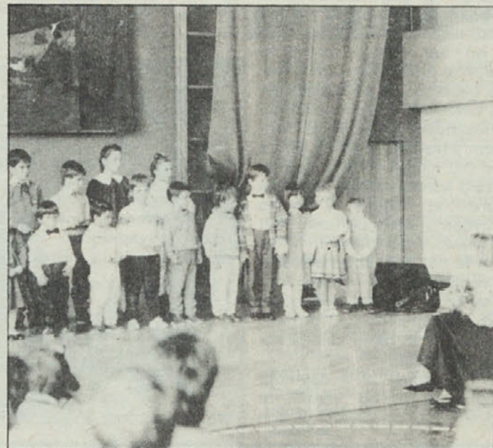
Najmlajši so prav posebno navdušili številno publiko.