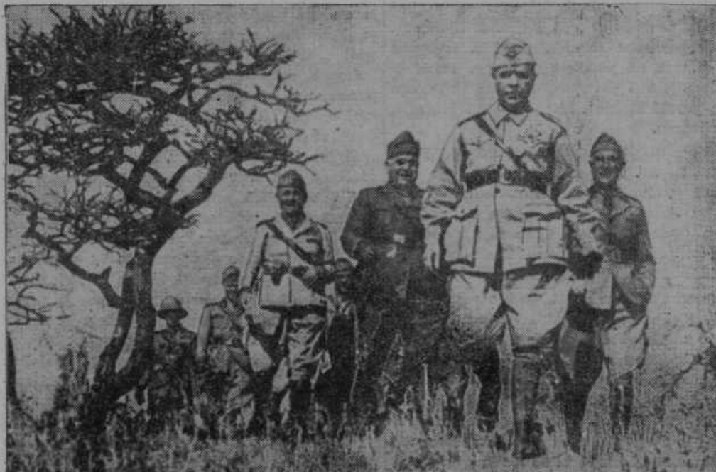
Italijanski maršal Badoglio na pregledu severne abesinske fronte v spremstvu svojega štaba.