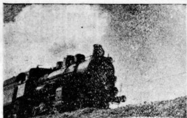
Ptujski železničarji so tudi letos, 15. aprila, praznovali svoj praznik s slovesnostjo pred spomenikom padlim. Zaključna slovesnost bo v soboto, 18. t. m., v Železničarskem domu.

Hidrometeorološki zavod LRS Ljubljana je zgradil po naročilu Elektrogradnarske skupnosti Ljubljana v Ptuj, v limigrafsko postajo na levem bregu Drave med starim lesenim in novim cestnim mostom. Nova ptujška limigrafsko naprava bo ugotovila povprečne dnevne vodostaje ter določila povprečni dnevni pretok Drave. Za merjenje vodnih množčin Drave v profilu je zgrajena še žična premostitev za merjenje srednjih in visokih voda s pomočjo čolna. V Ptuj, zgrajena limigrafsko postaja ne bo služila samo neposrednim potrebam hidroelektrarne Hajdoše, temveč bo tudi nadalje uporabna kot dobra vodomerska postaja v Ptuj, kjer se začne Drava razlivati v rokave. Na obrežju Drave se nahajajo sedaj 3 osnovne vodomerske postaje, opremljene z limigrafji in žično premostitvijo za merjenje vodnih množčin in merjenje srednjih in visokih voda. Po izpadu vodomerne postaje Vuhred in Maribor, bo še vedno delovala vodomerska postaja Ptuj kot edina vodomerska postaja za gornji tok Drave, zato bo tudi pravilno opremljena in vsestransko usposobljena za izvrševanje nalog.