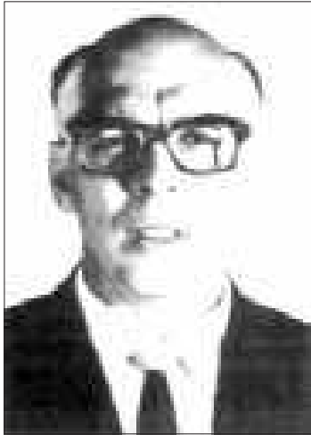
Ernesto Che Guevara inkognito na poti v Bolivijo

veljalo za dežele, na katere se je osredotočal Fanon, z gospodarskim imperializmom vendarle vladajo Južni Ameriki. Za vsako južnoameriško vlado stojijo Združene države. Debray je menil, da je severnoameriško bogastvo povzročitelj južnoameriške revščine.