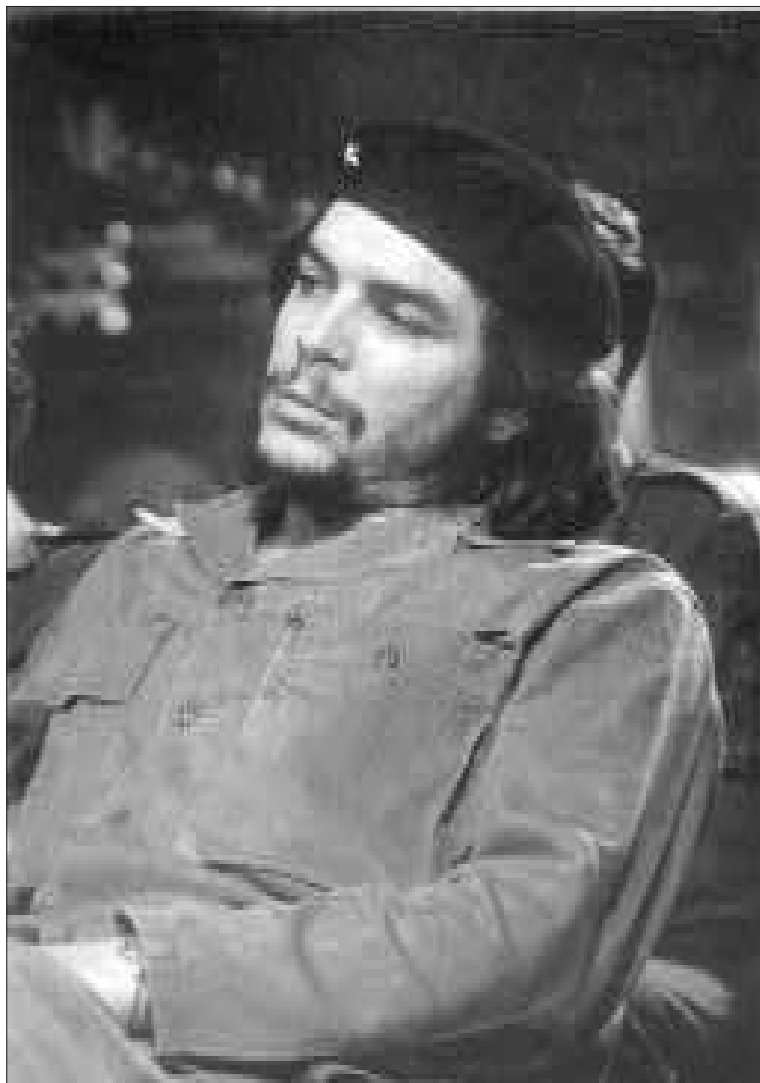
Ernesto Che Guevara

Leta 1954 pa so urugvajski obeti začeli bledeti. Skupaj z izvozom so padle tudi cene izvoznih izdelkov, kar je vodilo v inflacijo in brezposelnost. Okoli leta 1959 je Urugvaj doživel uničujoč gospodarski obrat in delavstvo ter srednji sloj sta se morala soočiti z nejasno prihodnostjo. Posebej hudo je kriza prizadela delavce v sladkorni