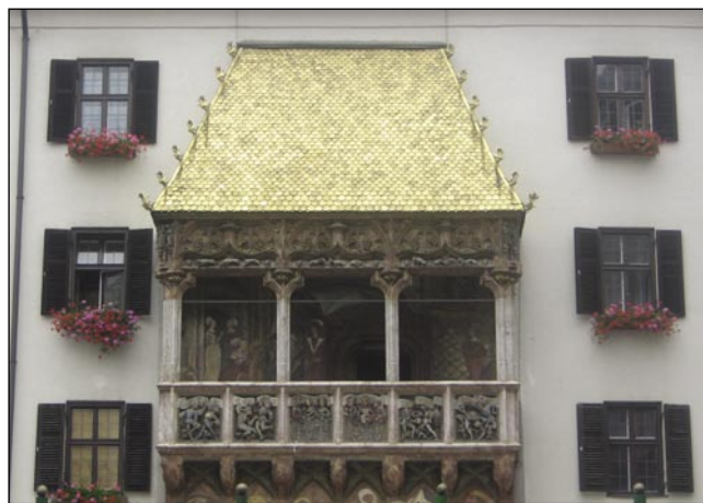
Erična „zlata streja“ v Innsbrucki

mali varaš Lugano, ka so vsi napisi na ramaj, bautaj pa kancelajaj s taljanskimi rečami gorspisani. Tau mesto, kak dosta drügi v Švajci, leži med bregami pauleg ednoga