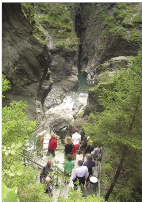
Globko v Via Mali nagla voda teče

Naša slejdnja postaja po švajcarskoj pauti je bila takzvana pečina (szurdok) Via Mala. Kak že dostakrat povödano, je Švajc rosag viski bregauv pa vodé. Največkrat pa se leko čüdivamo tomi, ka tau dvauje vküper napravi. Ime Via Mala ovak v malom retoromanskom geziki znanuše, ka »lagva paut«. Tau imé je pečina tak dobila, ka je v indašnji cajtaj tam najbolje žmetno bilau prejkpřiti na drügo stran vodé. Gnes pa se leko popotnik dosta trüdi, ka z asfalterane poti pride doj k potoki. Vauske pošťije, z levej kamen, s prave strani