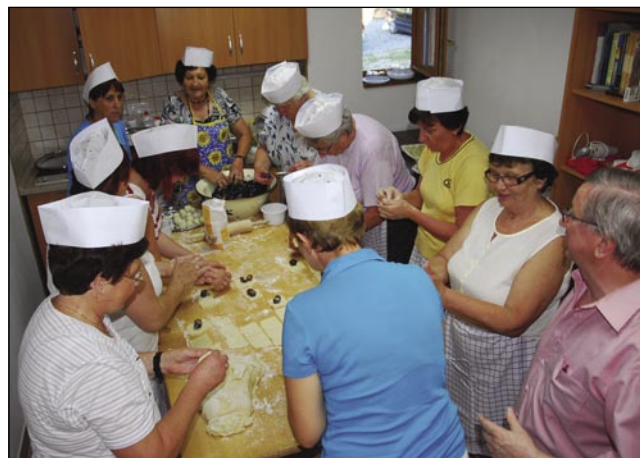
Küjanje globonclinov v »uniformi«

Prauti konci večera so se muzične škeri najšle pri Sombotelčaraj tö. Tačas, ka so se gostje eške nej pripravljali za paut domau, je pet goslarov v veukoj iži bilau. Dva fudaša, dvej kitare, pa edna pevka