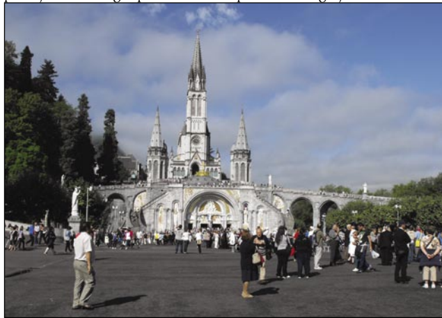
Lurdska bazilika, stera je zozidana nad tistov skalov, pod steroy se je v votlini skazala Marija

je Marija od 11. februara do 16. juliša 1858. leta osemnajsetkrat skazala v jami Massabielle. Prosi-la go je, naj se na tom mesti zozida kapejla pa naj pridejo es popi na procesijo. Naj se dela pokaura pa se molji za grejšne lidi. Ranč tak