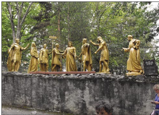
Deseta štacija na križnoj pauti, stero so dali postaviti vogrski katoličange 1912. leta

Popodnevna v petoy vōri se je začnila procesija bolnikov. Človek ne more ravnodušen (közömbös) ostati, gda vidi večgezero betežnikov, steri računajo na pomauč B. D. Marije. Njina procesija se je končala v baziliki pod zemlaup s tejm, ka so vōdjali oltarsko svestvo pa dobili blagoslov.