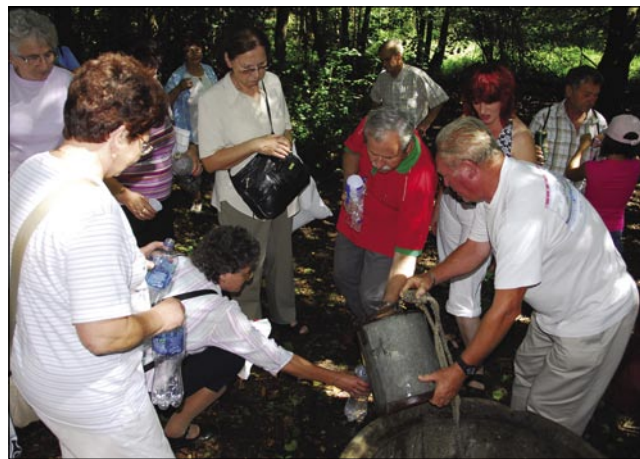
»Pijte, ka te na vöke živeli«

ne gratale. Bajdla pa valék iz Sombotela sta tö dobro slüžila. Ne vejmo djenau, što kelko globonclinov je zo, edno je gvüšno, ka je sombotelsko-andovska küjarska banda 380 mali takši slatki krügeu sküjala.