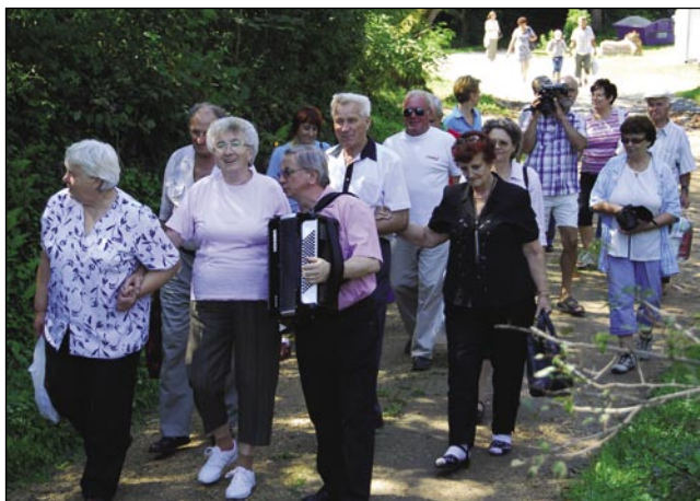
Aj se po vesi čuje...

ki prejkdala bajdlo pa valék. Tau do prej leko dobro ponúcali. Padaštvo med družt-