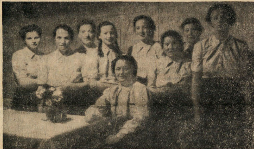
... in tečajnice z učiteljico