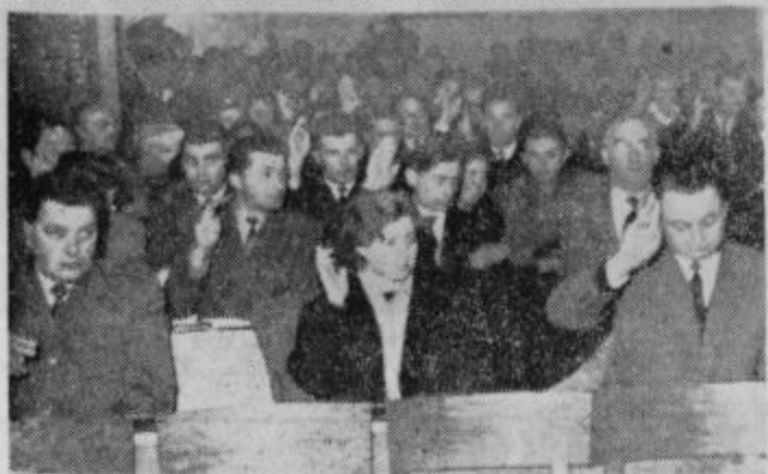
Glasovanje za konferenčne organe na konferenci SZDL 5. decembra 1962 v Ptuj

mało proizvajalcev — članov sindikatov je aktivnih članov socialistične zveze