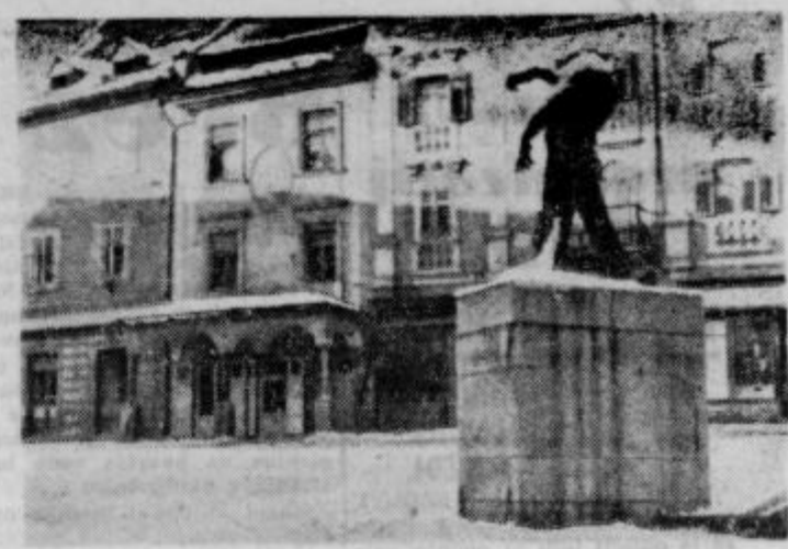
Spomenik heroja Lacka v Ptujju s sneženo oblogo

»Tednik izhaja pod tem skrajnim imenom od 24. nov. 1961 dalje na predlog Občinskih odborov SZDL Ptuj in Ormož — Izdaja »Tednik« zavod s samostojnim financiranjem — Odgovorni urednik: Anton Bauman — Uredništvo in uprava Ptuj, Lackova 8 — Telefon 156, čekovni račun pri Narodni banki Ptuj št. 604-19-1-206 — Tiska časopisno podjetje »Mariborski tiska« — Rokopisov ne vračamo — Celoletna naročnina za tuzemstvo 1000 din, za inozemstvo 1500 din.