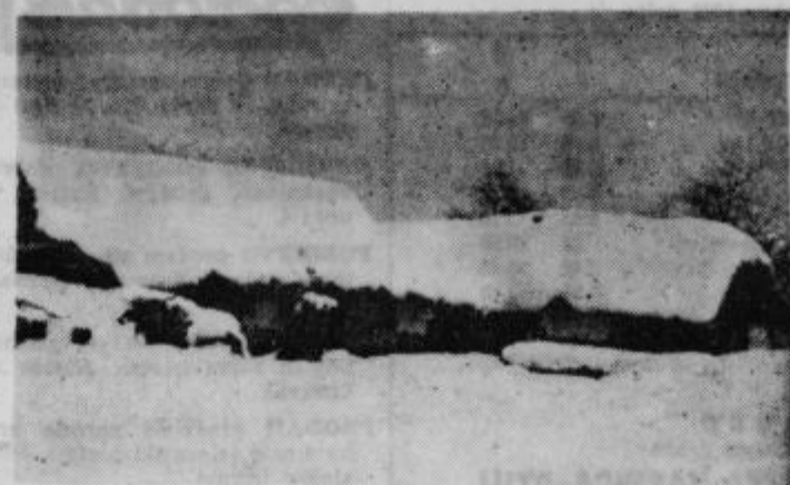
Kaj meni o tej podrtiji mimoidoči turist ali tujec?

Vedno hitreje kmečki prebivalci zapuščajo delo v kmetijstvu in odhajajo v industrijske centre. Na sliki je zapuščen stanovanjska hiša z gospodarskim poslopjem ob prometni cesti v Savcih pri Tomažu. Hišo bi bilo treba podreti in njene lesene dele uporabiti za kurjavo. Kaj meni o tej podrtiji mimoidoči turist ali tujec?