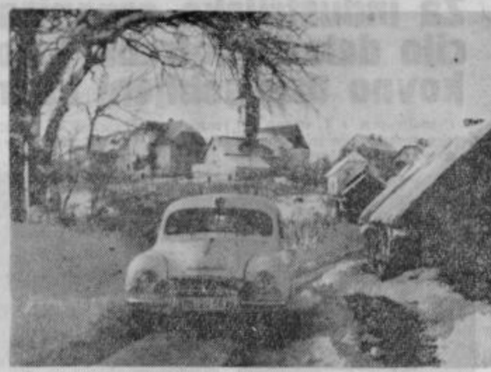
Reševalna postaja Ptuj pohiti večkrat na pomoč tudi v Desternik.