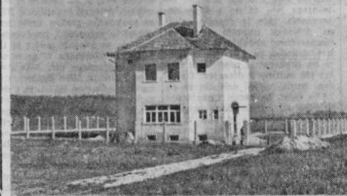
Vodovodna postaja v Skorbi s studencem in črpalkami

Kamione uporabljajo predvsem za razvoj reprodukcijskega materiala ter za prevoz odkupljene živine in kmetijskih pridelkov.