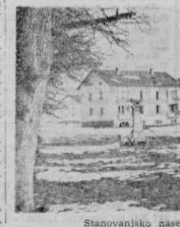
Stanovanjsko naselje TGA v Kidričevem

Fotoklub Kidričevo je organiziral v času od 2. do 8. decembra t. l. foto razstavo črno-bele fotografije. Na njo je povabil tudi Fotokluba Ptuj in Avtoopreme. Razstava je bila v barskih prostorih restavracije in jo je obiskalo mnogo fotomaterijev. Razstavljenih je bilo 30 obrabanih fotografij 10 najboljših fotomaterijev. Klub je poskrbel za 3 nagrade in skupni vrednosti do 10.000 dinarjev in 3 pohval za najboljše ocenjene fotografije.