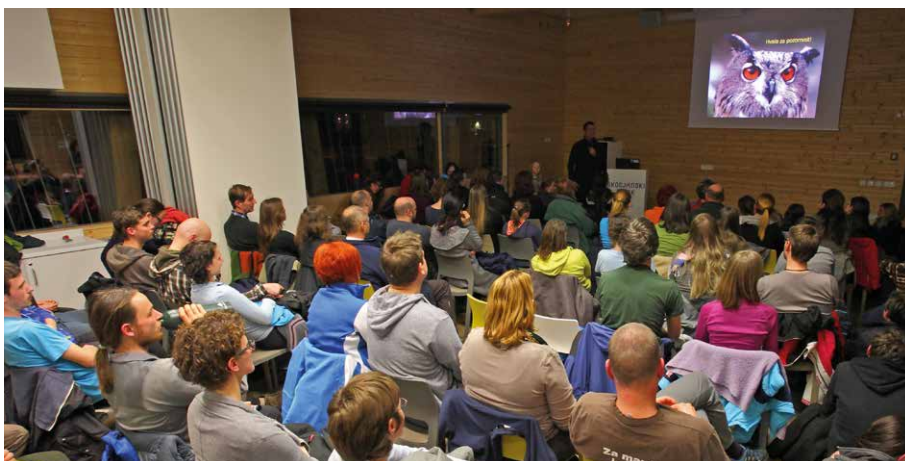
VELIKA UHARICA ( Bubo bubo )