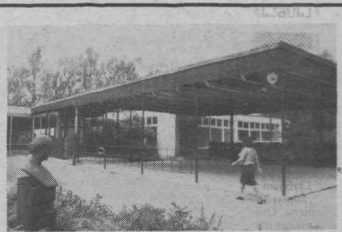
Zunanost VVO Angele Ocepek

Podobno se je dogajalo na Zaloški 181a. Tudi tam živi v zidanih barakah, ki so bile najprej pisarne nekega gradbenega podjetja, enajst družin. V bližini vrtarije v Sostrem — Pot v podgorje — stanuje v zidani baraki, ki pa je last ljubljanskih mlekar, precej njihovih delavcev z družinami. Tam je podjetje celo izdalo odločbe o stanovanjski pravici. Za te delavce bodo pač morale poskrbeti ljubljanske mlekarne same, medtem ko je občina štiri družine, ki so si zraven postavile lesene barake, uvrstila na spisek. Potem so tu še barake ob Sneberski 111, kjer živi pet družin, pa ob Sneberski 133 (šest družin), in ob Cesti v prod (ena družina). Skoraj odpravljeno pa je že barakarsko naselje ob Ljubljani v Zgornjem Kašlju, v katerem zdaj živi le še šest družin. Tri od njih bodo že novembra preselili v nova stanovanja, medtem ko trem stanovanjem ne pripada, saj so si barake postavili že po tistem, ko je bil napravljen popis vseh stanovalcev v barakarskih naseljih. Podatki, ki jih navajamo, so sicer od