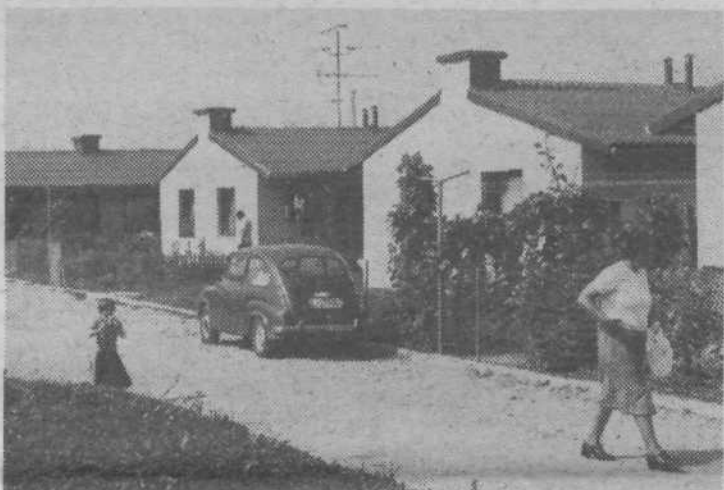
Naselje v Zgornjem Kašlju, zgrajeno po požaru v Tovarniški ul. št. 14 leta 1977

Do konca leta 1982 bomo odpravili barakarsko naselje v neposredni bližini Žita, kjer živi v barakah 22 družin. Občinski štab za odpravo barakarstva je že popisal vse stanovalce, do srede septembra pa namera obiskati 25 delovnih organizacij, v katerih ti ljudje delajo.