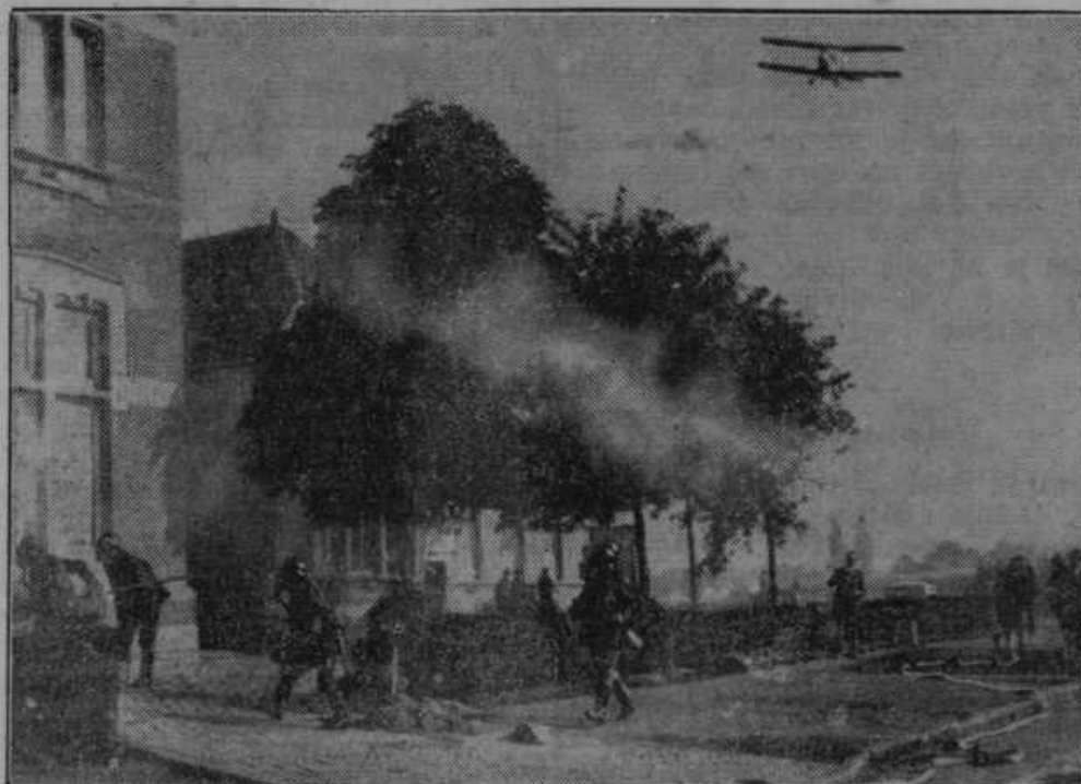
Poskusni napad s plini na belgijsko prestolico Brüssel.