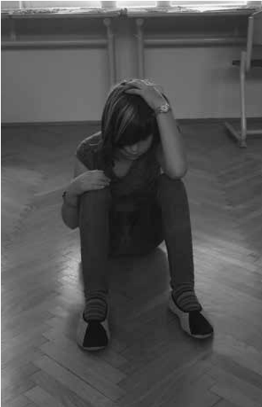
Slika 2: Deklica, ki sedi na tleh.