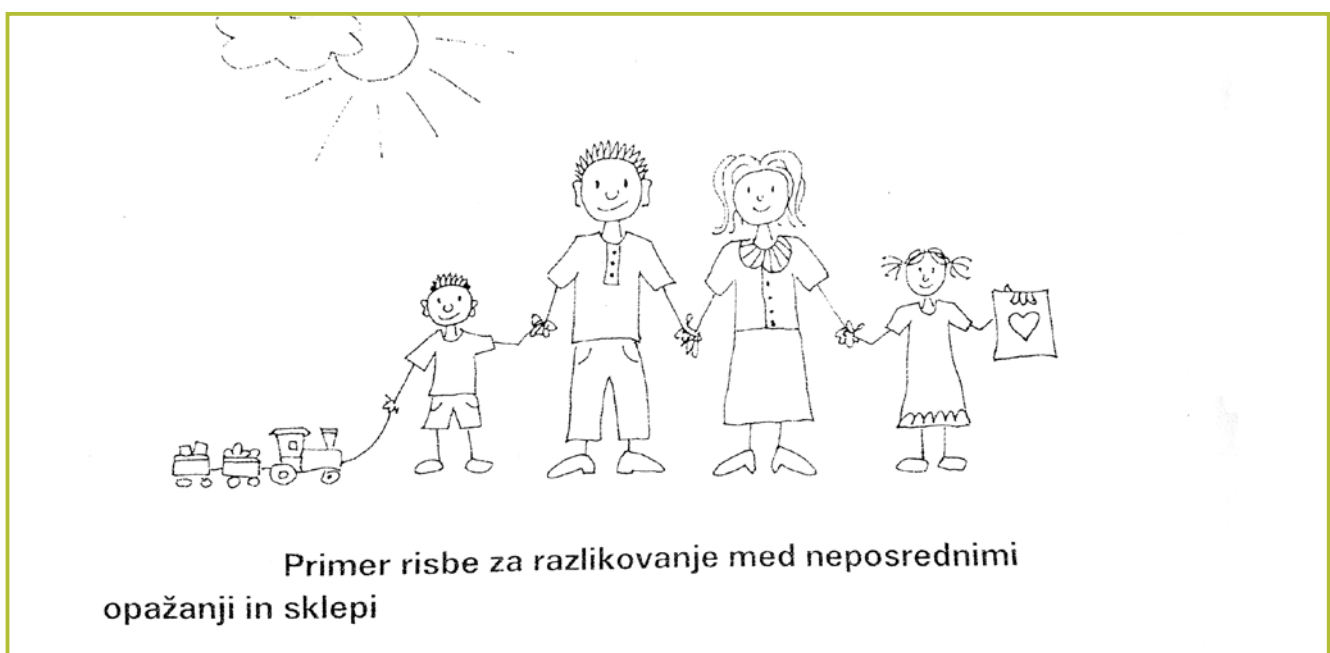
Slika 4: Risba štirih oseb (Vir: Kompore in Rupnik Vec, 2016: 163.)

Ugotovili sva, da so učenci po več izkušnjah oziroma različnih primerih opazovanja brez težav prepoznali večšino, ki smo jo razvijali. Izogibali so se prehitremu zaključevanju, pri oblikovanju trditve ali sklepa so se vedno manj opirali na čustva in na lastne izkušnje, skrbneje so premislili,