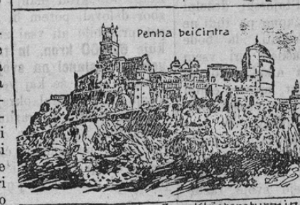
Penha bei Cintra