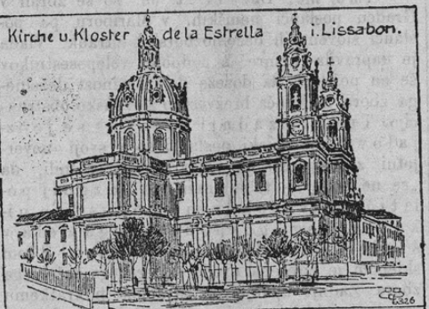
Kirche u. Kloster de la Estrella in Lissabon.