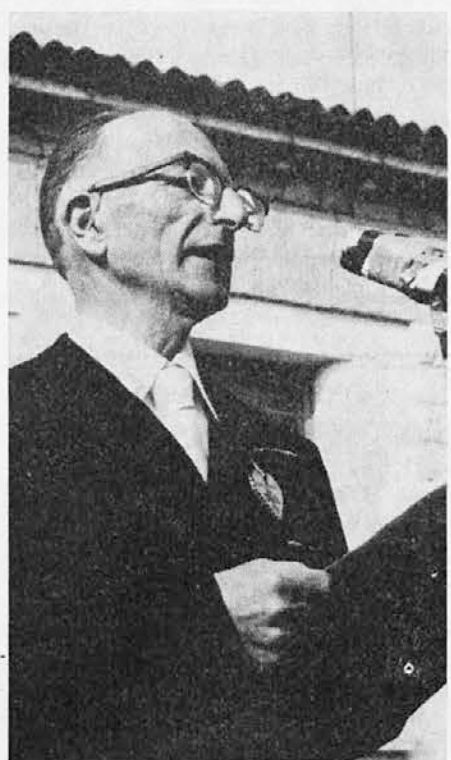
tve leta 1968.

Izpustili so ga in vrnili se je v Trst septembra 1946. Zaposlil se je na slovenskem radiu in ostal na tem mestu do upokojitve leta 1968.