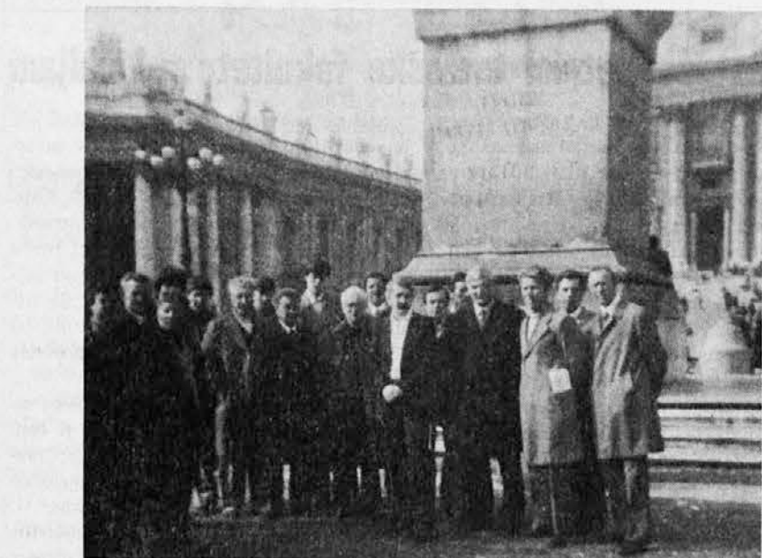
»Fantje izpod Grmade« na trgu sv. Petra

V ponedeljek 25. februarja so se »Fantje izpod Grmade« poslovili od prijaznih gostiteljev v Sloveniku. Še zadnjič so stopili v rimski »metro«. Ravno teden dni prej so namreč odprli novo podzemsko železnico v Rimu, ki prečka mesto od vzhoda do zahoda. Fantje so ugotovili, da je to velika pridobitev za Rim, saj se je mogoče zelo hitro premikati iz enega konca do drugega. Za 200 lir se npr. pelješ od Cinecittá do Sv. Pavla v manj kot pol ure s podzemsko A in B.