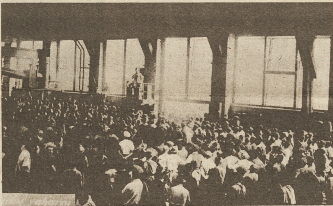
Jeseniški železarji so 15. VII. 1935 podprli delavce na Javorniku s solidarnostno stavko. — Delavski zaupniki poročajo stavkajočim jeseniškim železarjem o pogajanjih s Kranjsko industrijsko družbo (KID).