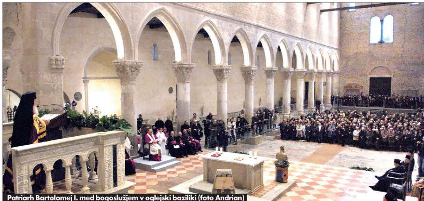
Patriarh Bartolomej I. med bogoslužjem v oglejski baziliki