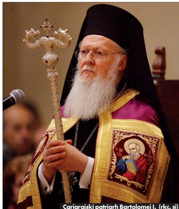
Carigrjski patriarh Bartolomej I.

O bisk carigrjskega patriarha Bartolomeja I. v naši deželi je bil predvsem lepo ekumensko srečanje, saj je Bartolomej I. v Ogleju v torek, 4. marca, izrecno poudaril: “Na tem mestu smo hoteli biti skupaj, kajti Kristusovo telo je eno, pa čeprav ga sestavlja več udov. Če smo v Kristusovem srcu združeni, vemo, kaj pomeni Milost Božja. In zato lahko rečemo, da nam je Kristus pokazal pot, po kateri lahko dosežemo edinost, pa čeprav še vedno obstajajo določene oddaljenosti med človekom in njegovimi brati. Prav tako se bo lahko zgodilo z našimi Cerkvami, ko se bomo sposobni razumeti med seboj v Resnici”.