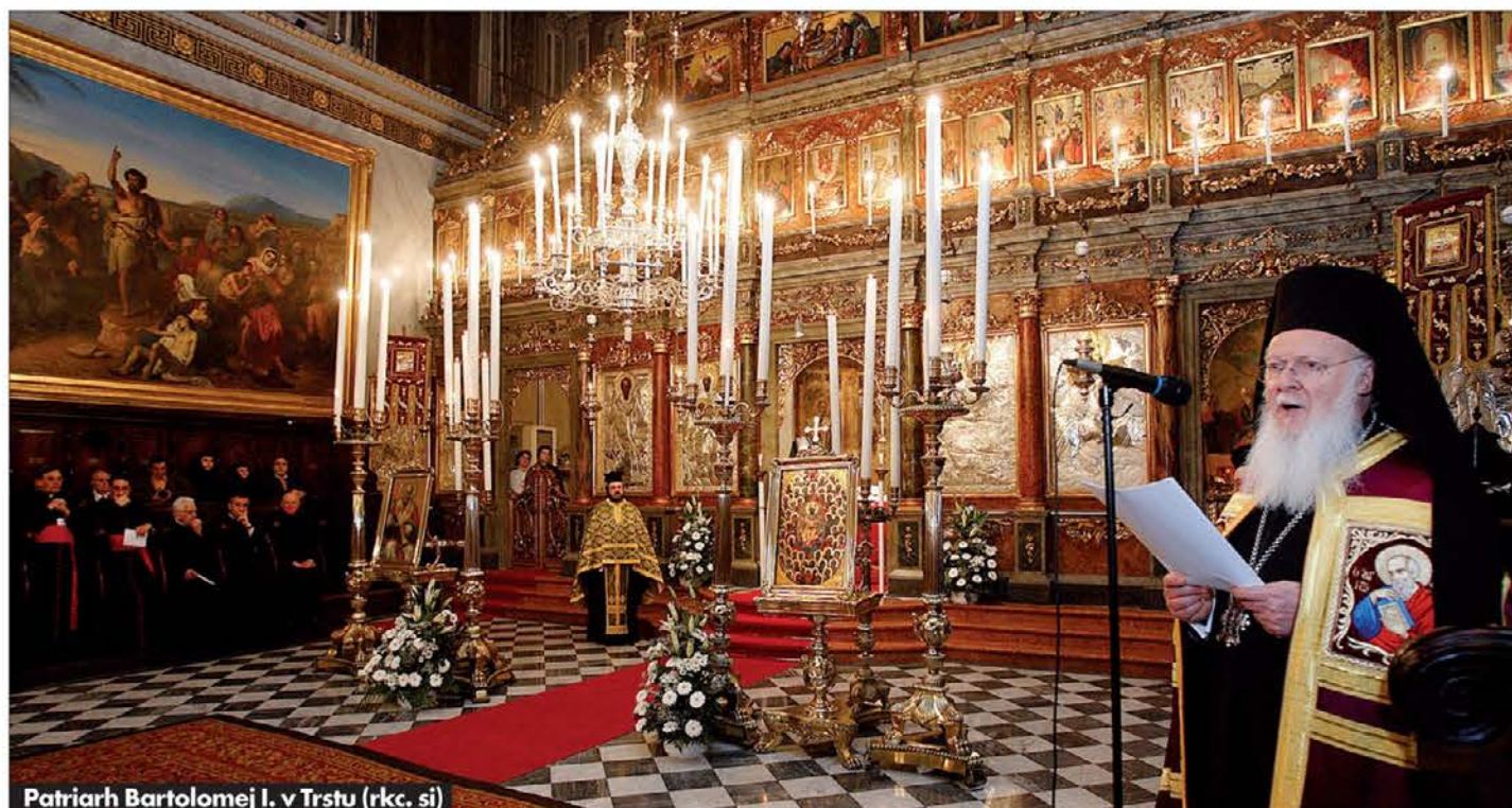
Patriarh Bartolomej I. v Trstu