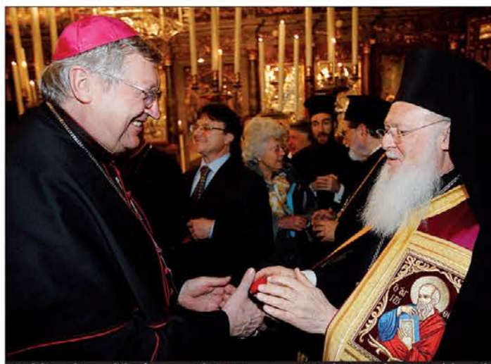
Ljubljanski nadškof msgr. Alojz Uran in patriarh Bartolomej I.