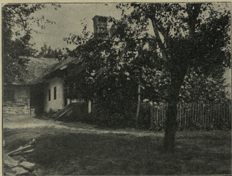
Flegeričeva rojstna hiša.