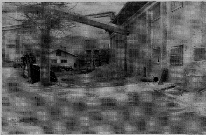
Ko je odlezel sneg, se je prikazalo »tihožitje«