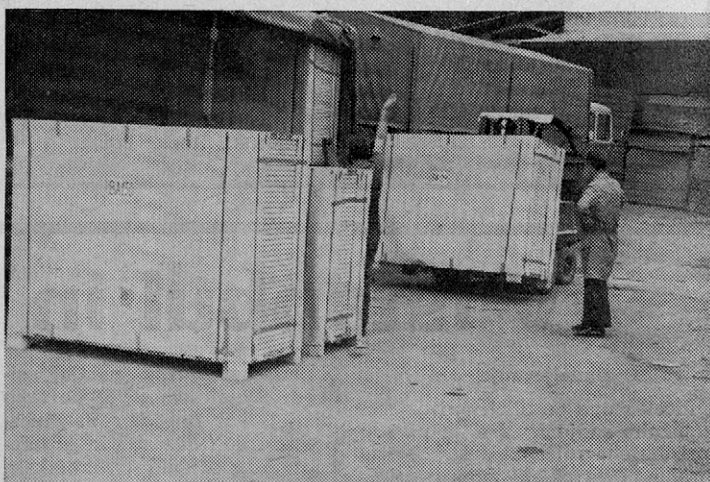
Tako pakirana vrata izvažamo v Avstrijo

Vsem, ki pa so v preteklem letu sodelovali v krvodajalski akciji in dali svojo kri za reševanje ljudi v nesrečah, pa naj-iskrenejša zahvala.