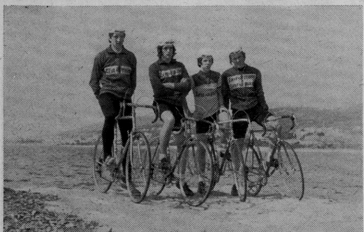
Kolesarski klub Bled, katerega pokroviteljstvo je prevzelo naše podjetje, se je udeležil skupnega treninga v Selcah z avstrijsko kolesarsko ekipo, katere pokrovitelj je tovarna »Alpine« iz Freilassinga.

»Sedaj naj pa eden od vaju poljubi nevesto!«