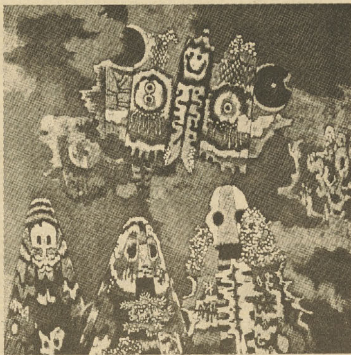
France Mihelič: Vešče, 1970, olje, pl.