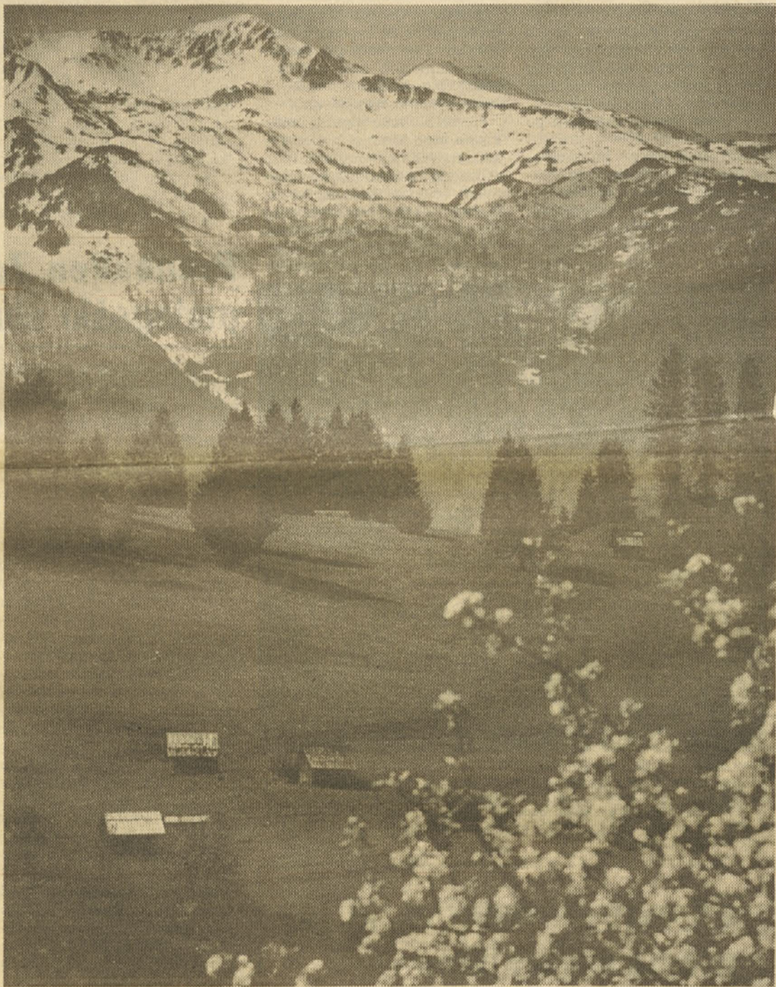
Joco Znidaršič: Bohinj

SONČNE IN PRIJETNE PRVOMAJSKE PRAZNIKE VSEM NAŠIM BRALCEM IN SODELAVCEM!