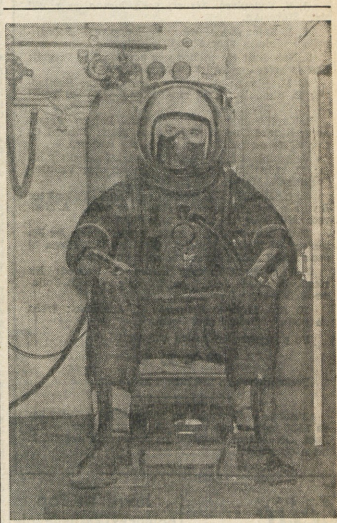
Opremo za višinsko letanje letalcev ameriške vojne mornarice, ki jo vidimo na sliki, so preizkusili pod pogoji, kot so v višini nad 23.000 m, kjer brez take opreme nastopi v nekaj sekundah neizogibna smrt.

Dokazano je zdaj, da lahko vibracije, ki jih doživljajo delavci pri nekaterih stalnih in prenosnih strojih, vendar ne vse, povzročijo Reynaudov pojav. Ni pa zadostnih dokazov za domnevo, da vse take zaposlitve ali vsi tresoči stroji povzročajo »mrtvo rok«. Zda se skušajo rešiti vprašanje na podlagi izkušenj, ki jih zbirajo. Vse take bolnike preiskuje zdravnik, stroške je deloma prevzelo ministrstvo državnega zavarovanja.