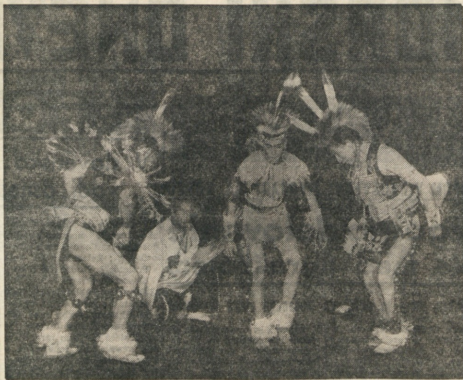
Z zvončkanjem, bobnanjem in petjem spremljajo ameriški Indijanci sbojni ples, ki ga plešejo v silikovitih narodnih nošah.

čil v prvomajskem proglasu, je oznanjal, da se bliža čas, ko bo primorsko ljudstvo znalo streči okove, in si priboriti lastno osvoboditev. Slovenskim množicam je priklical v spomin stoletno borbno slovenskega naroda od kmečkih puntov do uporne, vsakdanje požrtvovalne borbe primorskega ljudstva, ki ga ves teror fašistične strahovlade ni mogel zlomiti. In tako je tudi za fašizma, ob prvomajskih ilegalnih proslavah, primorsko ljudstvo jeklenilo svoj značaj, krepilo duha odpora in se pripravljalo na velike dni osvobodilnega boja, ki je, ob izbruhu fašističnega napada na svobodoljubne narode, zajel tudi vso Primorsko in jo, skozi legendarno epopejo solza, krvi in junaštva, privedel na prag svobode in socializma.