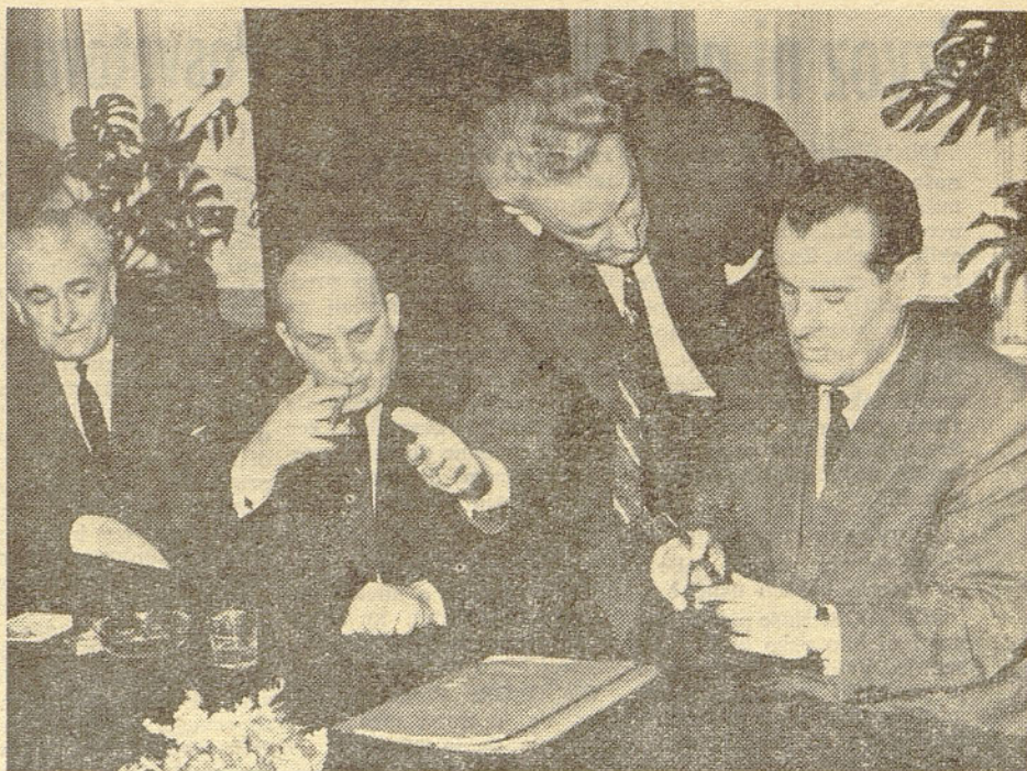
Direktor PTT podjetja Beograd s predstavniki iz Beograda ob podpisu pogodbe za dobavo novih Iskrinih ATC za področje našega glavnega mesta

ODGOVOR: Vsaj v letu 1964 je bilo očitno, da posamezna podjetja niso dobila deviz le zaradi neizpolnitve izvoznih obveznosti, temveč tudi splošnega pomanjkanja deviznih sredstev. To pa je posledica ne samo neizpolnitve izvoznih obveznosti posameznih kolektivov, temveč vsega jugoslovanskega gospodarstva in pa previsokega uvoza na (Dalje na 2. strani)