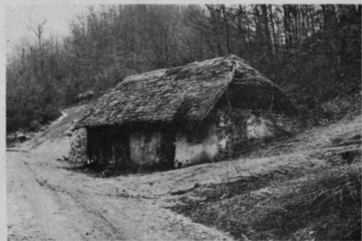
V tej ipični haloški hiši je pred leti bilo še lepo. Dosti otrok je capljalo v njej, vselje je bilo pri hiši. Sedaj ni več življenja v njej. Stari zidovi popuščajo, tramovi na strehi so strohnili. Čez nekaj let bo to le še del hriba.

Mlajši rod odhaja na delo izven domačega kraja. Večina zaposlenih