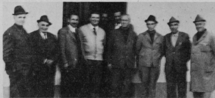
Po razgovoru o vaških skupnostih v Forminu

Prevleka bo kmalu sledila, za forminsko prireditev za otvoritev asfaltiranih cest pa še dan ni določen, vsekakor pa bo v času, ko bo lahko prireditev na prostem. Oficielni del otvoritve bo bržčas za 29. november. Na slovesnostih razdeljena priznanja in pohvale bodo prav gotovo v veliko zadoščenje vsem za asfalt tudi na Forminu.“ J. V.