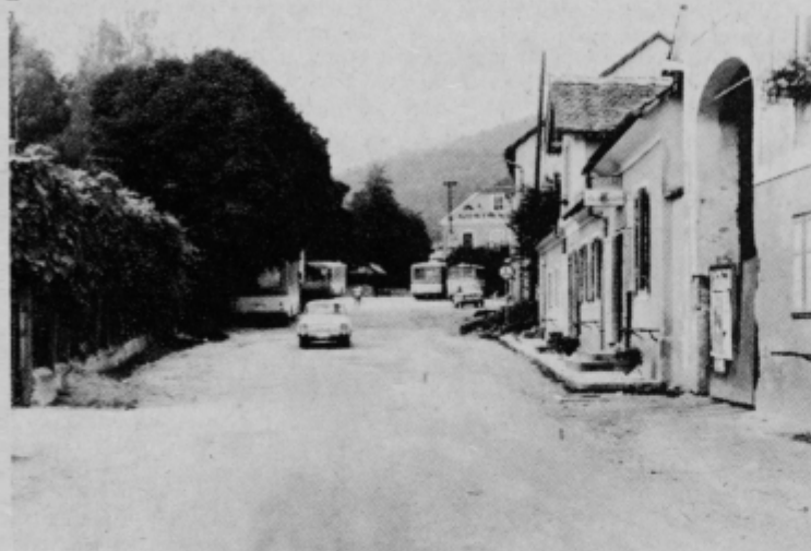
Z avtobusi dobro založeno središče Oplotnice

Zadnji čas odhaja mnogo Oplotničanov in okoličanov vsak dan za zaslužkom v oddaljene industrijske kraje in je tako postala avtobusna zveza z Oplotnico in zaledjem večkratna. Prav ta pridobitev pa je na drugi strani postala ovira za nekdanj kilično središče kraja. Ker ni parkirnega prostora,