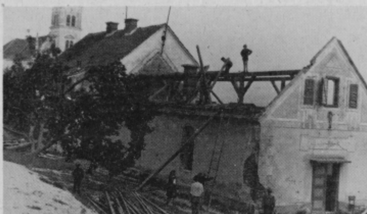
Staro telovadnico v Oplotnici bo potrebno temeljito obnoviti, pri tem pomagajo tudi krajanji in mladina.