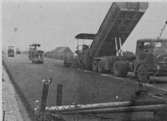
Slovenika postaja tudi v bistrški občini resničnost

Kljub slabemu vremenu, ki vlada že daljše obdobje, dela na naši bodoči avtocesti Sloveniki z nezmanjšano hitrostjo napredujejo. Sodobna mehanizacija in prizadevanost delovnih organizacij, ki so prevzele gradnjo naše cestne lepote, omogočajo da dela hitro napredujejo, in bodo, če ne bo večjih ovir, tudi do roka končana.