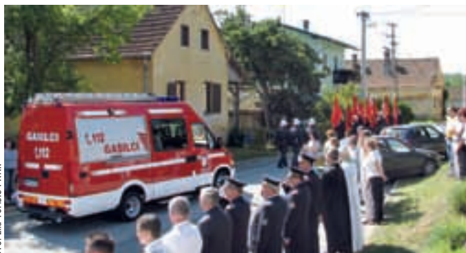
ČIKEČKA VAS: GASILCI Z NOVIM VOZILOM – V Čikečki vasi so slovesno predali namenu novo, sodobno opremljeno gasilsko vozilo, iveco daily, letnik 2002. Vrednost naložbe je 32.744 evrov.