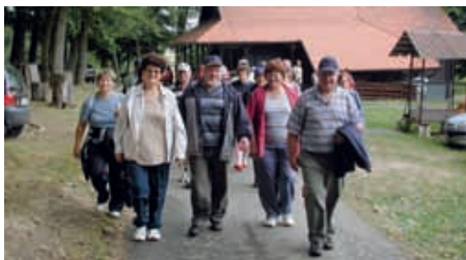
PROSENJAKOVCI: UPOKOJENCI NA POHODU – DU občine Moravske Toplice je konec junija pripravilo tradicionalni pohod.