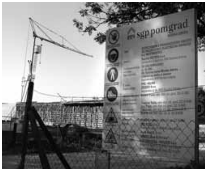
KONEC IDILIČNE GORIČKE VASICE

Šele po skoraj dveh tednih, ko se je gradnja že dodobra razmahnila, je izvajalec del, SGP Pomgrad – Gradnje d.o.o., izobesil sramežljivo malo gradbeno tablo, iz katere so domačini tudi izvedeli, kaj pravzaprav nastaja v njihovem kraju tik ob nogometnem igrišču, čez cesto pa je krajevna cerkva in v stari šoli tudi kulturna dvorana z orodiščem za gasilce. Zagnali so vik in krik in v protest sklicali zbor krajanov.