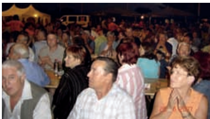
FILOVCI: PETI PRAZNIK KRAJEVNE SKUPNOSTI – Z več prireditvami (dobrodelnim koncertom »EURO za lažjo pot v solo«, festivalom vina in pesmi ter javno radijsko oddajo »Pod brajdami«) je KS Filovci proslavila svoj 5. praznik. Razveseljiva je množična udeležba, saj se je na njih zbralo več kot tisoč obiskovalcev.