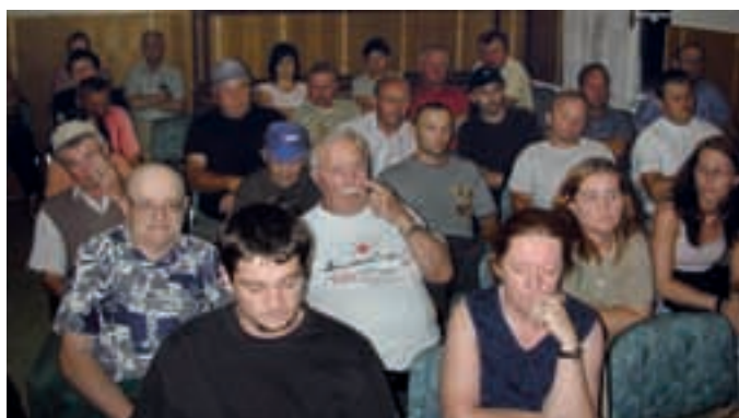
MOTVARJEVCI: DOMAČINI OSTRO NASPROTUJEJO GRADNJI BIOPLINARNE – V Motvarjevcih so gradbeni stroji zabrneli prej, kot so se domačini zavedli, da na zemljišču Panvite, v neposredni bližini kalvinske cerkve in kulturne dvorane gradijo bioplinarno. Ko so to izvedeli, so se na zboru gradnji silovito uprli.