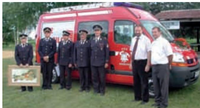
BOGOJINA: Z VELIKIM TRUDOM DO NOVEGA AVTA – Novo vozilo, opremljeno za potrebe gasilcev, so v juniju prevzeli tudi bogojinski gasilci.