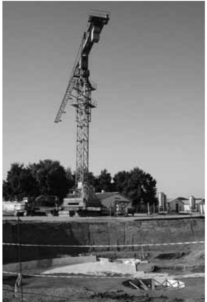
Gradnja se nadaljuje. Po visokih betonskih depojih za koruzno silažo so sedaj na vrsti velikanski zemeljski izkopi za reaktorje.

Povabil je krajanom Motvarjevec, naj si ogledajo delovanje podobnih kmetijskih bioplinarn – nekaj jih je že tudi v Sloveniji – in se prepričajo o morebitnem motečem vplivu na okolje. Svoje razmišljanje je zaključil z besedami, da bi bilo morda res prav, da bi med pridobivanjem dovoljenj za gradnjo opravili tudi informativni razgovor s krajanom, vendar jim zakonodaja tega ne nalaga. »Panvita ni pisala zakonov, niti jih ne sprejema,« je dejal, rekoč, da so si po zakonodaji za gradnjo morali pridobiti edino soglasje občine. In to so tudi storili.