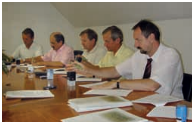
MORAVSKE TOPLICE: PODPISAN DOGOVOR O MEDOBČINSKI INŠPEKCIJI IN REDARSTVU – Župani desetih prekmurskih občin so s podpisom dogovora o pravicah in obveznostih storili še zadnji korak do ustanovitve medobčinske inšpekcijske in redarske službe.