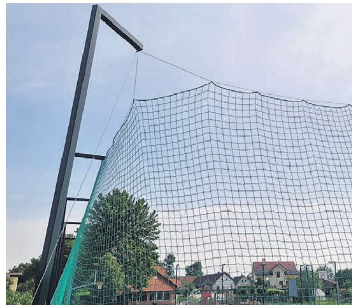
Eden izmed stebrov se je že hitro po postavitvi nagnil.