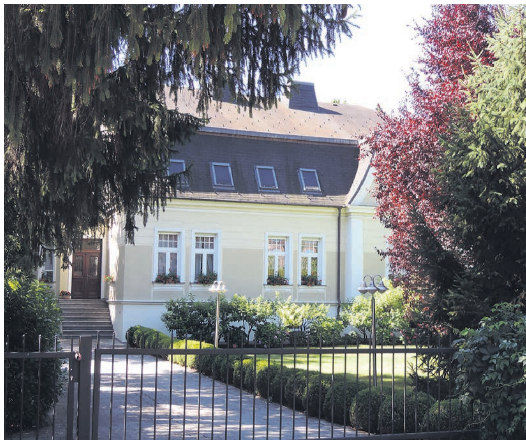
To je vilo, za katero je ZD Ormož odštel 447.200 evrov, čeprav bi jo, glede na potek dražbe, lahko kupil za 262.200 evrov.

Postopno višanje izhodiščne cene je na vseh javnih dražbah, tako klasičnih kot spletnih, povsem legitim in pričakovani proces med kupci oz. interesi. Predmet dražbe na koncu kupi tisti, ki ponudi najvišjo ceno zanj. Po informacijah, ki smo jih prejeli, pa naj bi ZD Ormož po nepotrebem (brez dviga ponudbe konkurenta) višal ponudbeno ceno in za nepremičnino ponudil kar 185.000 evrov več od izključne. Dražbe naj bi se udeležila dva dražitelja, poleg ZD Ormož še neznan dražitelj (domnevno nekdanji lastnik), ki je kot prvi ponudil izključno ceno 261.100 evrov. ZD Ormož naj bi takoj za tem zvišal ponudbo najprej za 100 evrov, na 261.200 evrov, nato pa naj bi ceno zviševal v časovnih razmikih od 5 do 20 sekund, in sicer vsakič za 2.000 evrov, čeprav prvi dražitelj sploh ni več dražil. V nekaj minutah naj bi tako ZD Ormož ceno zvišal za kar 185.000 evrov. Oba dražitelja sta bila ves čas seznanjena o vsakokratni najugodnejši ponudbi. »ZD Ormož bi torej lahko nepremičnine, ki so bile predmet javne dražbe, kupil po ceni 262.200 evrov, kupil pa jih je za 447.200 evrov, kar je kar 70 % več od prvotne ponudbe, ki je bila takrat tudi najvišja. Z opisanim ravnanjem je bila povzročena velika