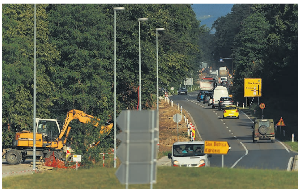
Zastoj zaradi obnove ceste in enosmerno urejenega prometa je na glavni cesti skozi kidričevski gozd pričakovati do pozne jeseni.

čine Kidričevo znaša 87.000 evrov. Dela izvajajo Cestno podjetje Ptuj (CPP), ki je vodilni partner, ter podjetja Asfalti Ptuj, GMW in Tegar. Na DRSI so pojasnili, da cena in rok