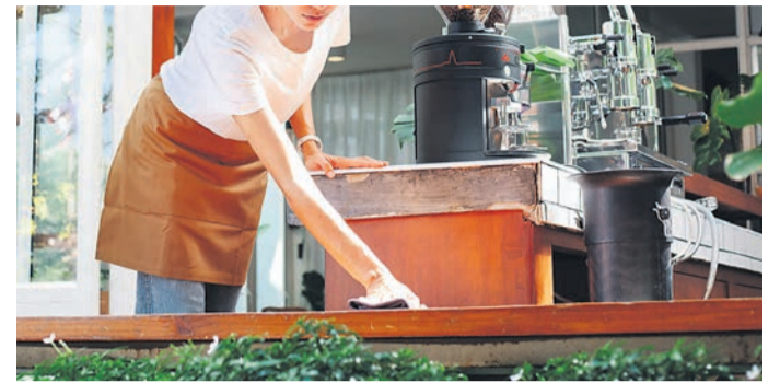
Fotografija je simbolična.

Najemnik bo moral, kot vsi ostali gostinci z vrtom, plačevati tudi uporabnino javne površine. Ta je izračunana na podlagi Odloka o oddaji javnih površin v mestni občini Ptuj. V letu 2022 uporaba javne površine za gostinski vrt v izmeri 60 m 2 znaša 2,73 evra dnevno, to z davkom zneske okrog 100 evrov mesečno. Ponu-