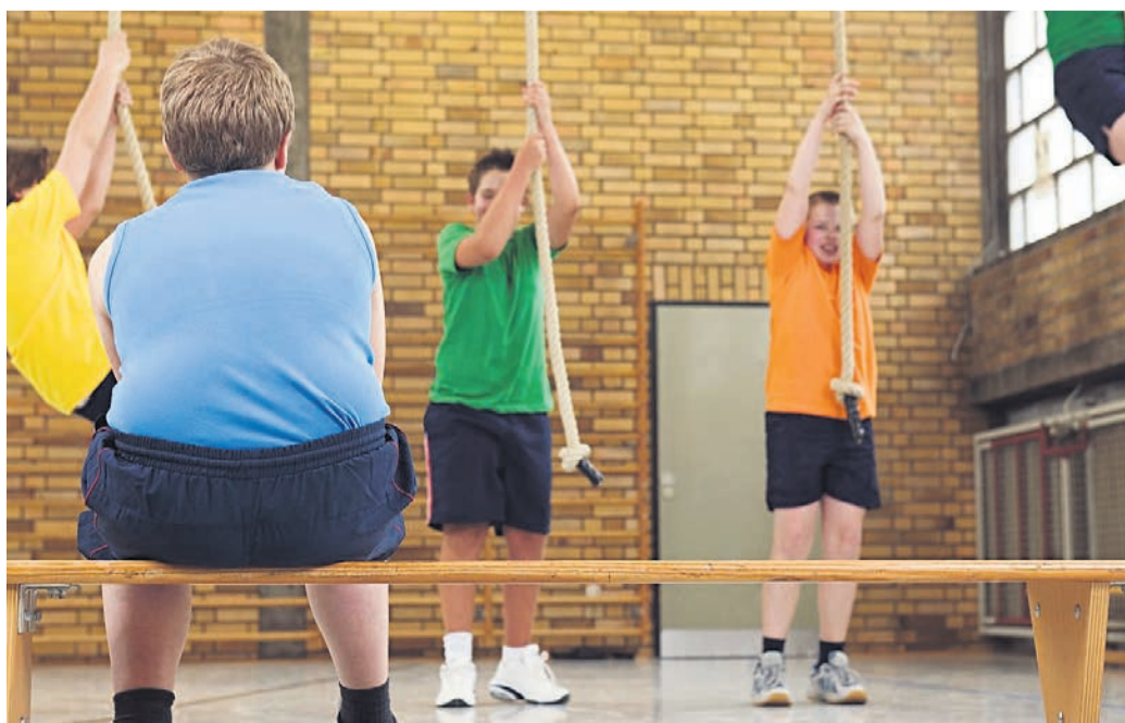
V Podlehniku nad preveliko težo otrok z izboljšanimi jedilniki in dodatnimi urami športne vzgoje

komerno prehranjenih otrok narašča s starostjo učencev. Pri tem jo podpira občina, ki med drugim financira dodatne gibalne aktivnosti otrok (dodatne tri ure športne vzgoje), na starših in otrocih pa je,