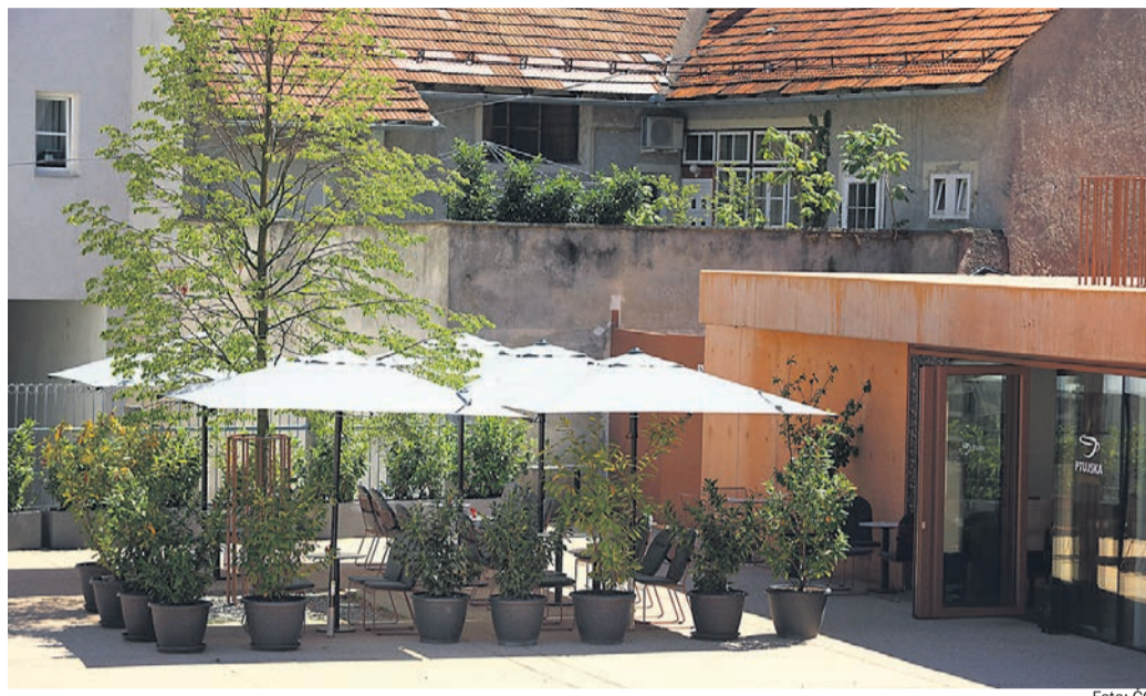
V ceno najema lokala ni zajet najem letnega vrta in opreme, ne notranje, ne zunanje.

Že v razpisnih pogojih je bilo navedeno, da je možno od podjetja Javne službe Ptuj, ki je urejalo lokal, najeti tudi notranjo, gostinsko