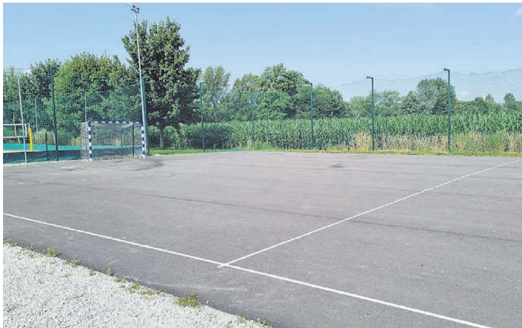
Na igrišču v Novi vasi je občina ugotovila nekaj pomanjkljivosti.

Občini Markovci je lani omenjeno naložbo v višini okoli 62.000 evrov uspelo uvrstiti v proračun in tudi izvesti, a očitno povsem mimo gradbene zakonodaje, čemur se po domače enostavno reče črnogradnja.