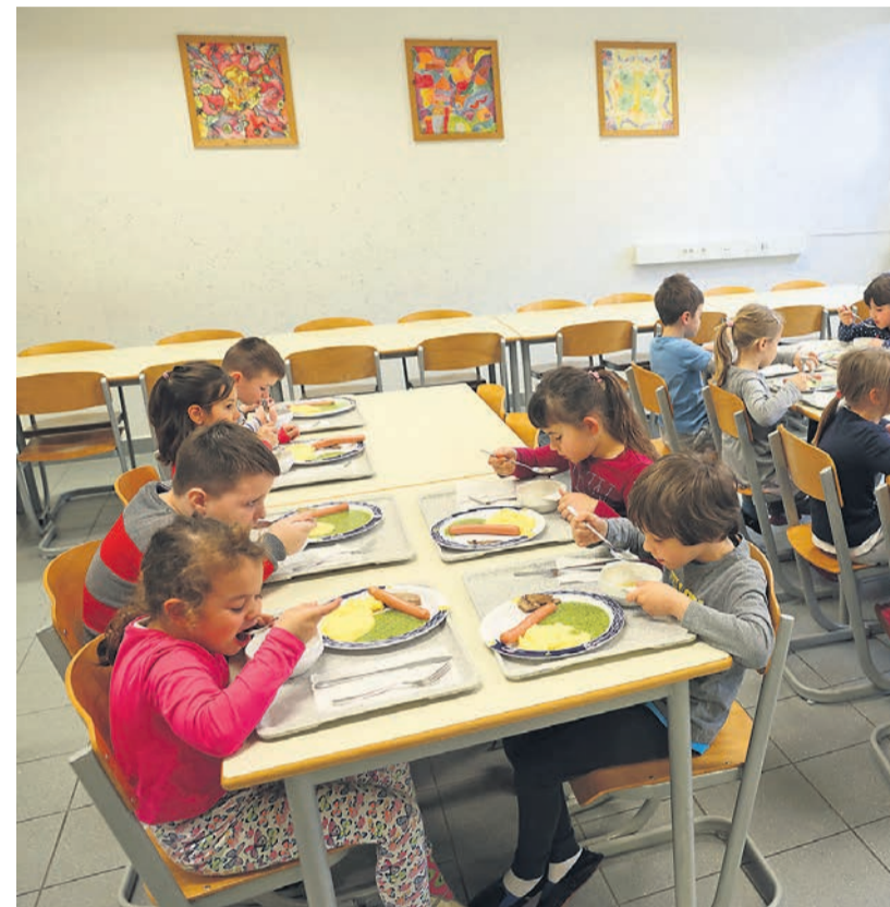
Šolsko ministrstvo bo s prvim septembrom dvignilo enotno ceno malice.

jeli s prvim septembrom. Razlike med šolami so precejšnje, in sicer v povprečju za okoli 60 centrov po kosilu, kar mesečno nanese približno 12 evrov na položnici. Do njih prihaja predvsem zaradi različnega števila učencev po posameznih šolah, organiziranosti kuhinje, višine morebitnega subvencioniranja lokalne skupnosti, cene živil. Šole