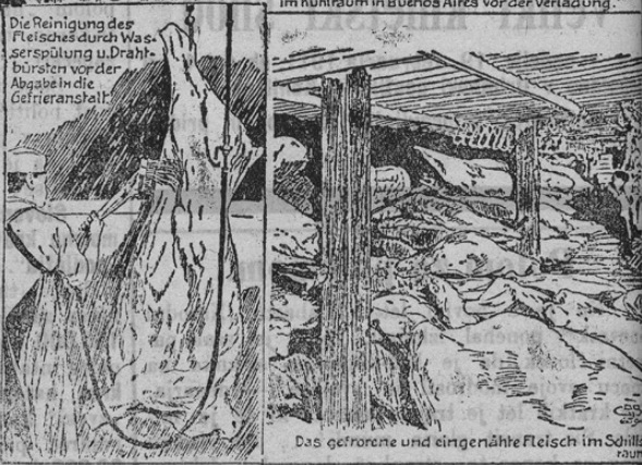
Das gefrorene und eingesehte Fleisch im Schlachtraum.

Zur Einfuhr argentinischen Fleisches in Osterreich.