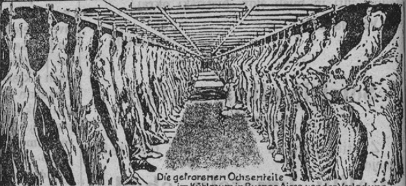
Die gefrorenen Ochsenfleisch im Kühlraum in Buenos Aires vor der Verladung.

Mesece sem so že listi polni pritožb radi draginje mesa. Naše mnenje je sicer, da naj bi se dalo kmetu sredstva, da pospeši domačo živinorejo. Kajti le na tej podlagi je mogoče, da se te razmere izboljšajo. Ali merodajni krogi so raje dovolili izvoz mesa iz Argentinije v južni Ameriki. Argentinija ima namreč preveč živine in zato prav rada meso izvaž. Prve pošiljkatve so prišle tudi že v večja mesta. Seveda so potrebne posebne priprave da se meso na dolgem potovanju ne pokvari. Naše slike kažejo te priprave i. s. vidimo: zgoraj zmrzjene dele volov v skladišču v Argentiniji; meso se pusti namreč zmzniti, ker le na ta način se zamore preprečiti, da se pokvari. Spodaj (na levi strani vidimo, kako se meso čisti z vodo in s krtačo iz drata. Na desni strani pa vidimo meso, ki je sešito in zmznjeno, v skladišču velike pomorske barke. Posebno lepih uspehov se doslej s tem mesom ni doseglo.