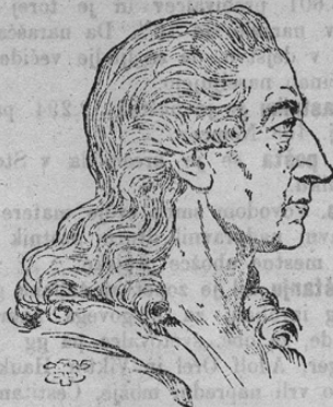
Anton Fürst v. Kaunitz-Riefberg

2. svečana je 200 let, odkar se je porodil V. A. knez Kaunitz-Riefberg, ki je bil pozneje desna roka ce-