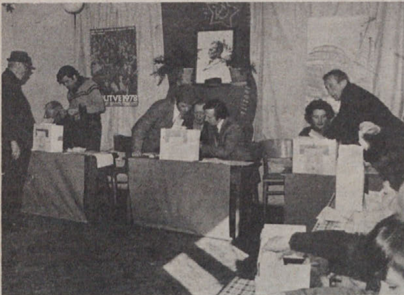
Na volišču v Česnjicah so že sredi dopoldneva zaključili volitve, zato so člani volilnih odborov lahko začeli s preštevanjem glasov