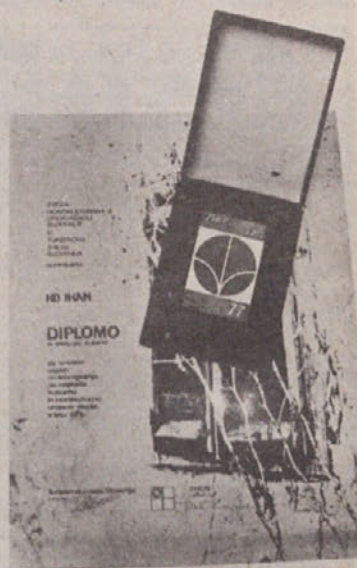
Bronasta diploma, ki jo je prejelo Hortikulturno društvo v Ihanu

Pa se povrnimo še v KS Ihan, kjer smo že v naslovu zapisali, da v „Ihanu tudi ne spimo“. In resnično ne spimo, kajti glede organiziranosti na tem področju smo že pred samimi Domžalami. Že takoj po uspešni uveljavitvi delegatskega sistema, smo v KS izvolili tričlanski odbor za varstvo okolja in narave. Začele so se delovne akcije mladine, gasilcev, nogometašev in ostalih. Organizator je bil prav ta odbor. Ko so delegati v KS videli, da se dela resno, smo bili deležni tudi finančne pomoči. Na pomoč smo poklicali tudi Arboretum. Z njihovo strokovno pomočjo in materialom smo uredili veliko neurejenih površin, katere so bile last SLP. Uredili smo tudi okolico novega vrtca, katerega lahko prištevamo k enemu najlepše urejenih vrtcev v Sloveniji. Organizirali smo odvoz smeti, odstranili „divja“ smetišča, postavili opozorilne table in še bi lahko naštevali. Vsa ta dela dobivajo vso večjo razsežnost, vse več se gradi. Delali bomo novo pokopališče, zgradili bomo nov center Ihana, zato smo se v odboru odločili, da ustanovimo Hortikulturno društvo. Preteklo leto marca, po ustanovni skupščini in zanimivem predavanju smo ga tudi dobili.