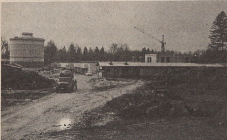
Na gradbišču centralne čistilne naprave v Študi potekajo dela po načrtih in graditelji pravijo, da bo do konca julija vse na red za otvoritev

Glede na to, da bo koncem meseca julija začela obratovati čistilna naprava, je potekala razprava