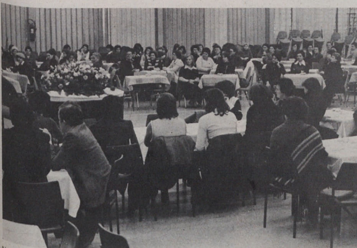
Na zboru delegatk v Domžalah, ki je bil namenjen seznanjanju o delu v skupščinah, položaju žensk in njihovem prazniku