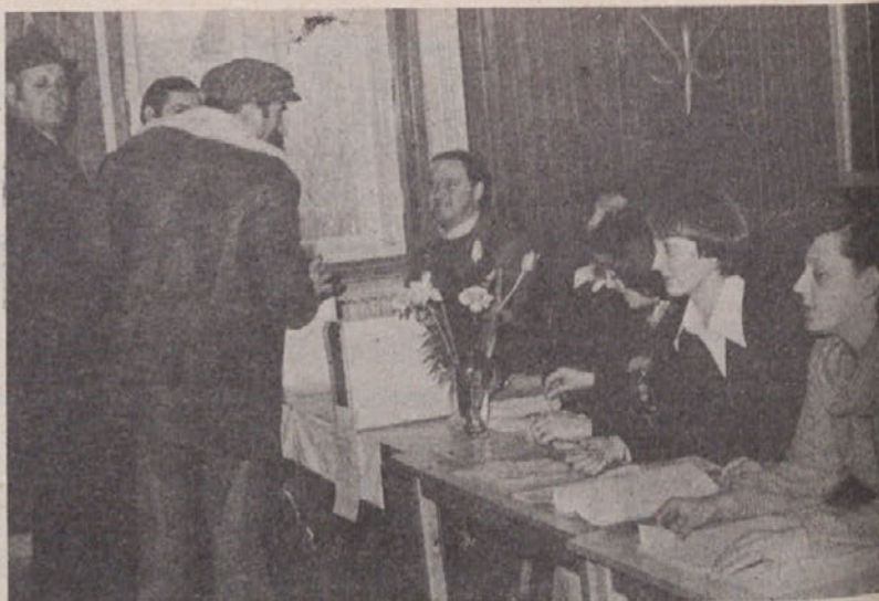
Tudi obrtniki in pri njih zaposleni delavci so 9. marca volili svoje delegate za zbor združenega dela in skupščine samoupravnih interesnih skupnosti

Na voliščih v KS je potekalo tudi glasovanje o delegatih za druž-