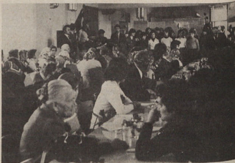
S srečanja žensk, ki je bilo za članice ZVVI ob 8. marcu organizirano v Domžalah