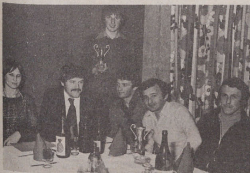
Nagrajenci, ki so prejeli priznanja za svoje uspešno športno delo