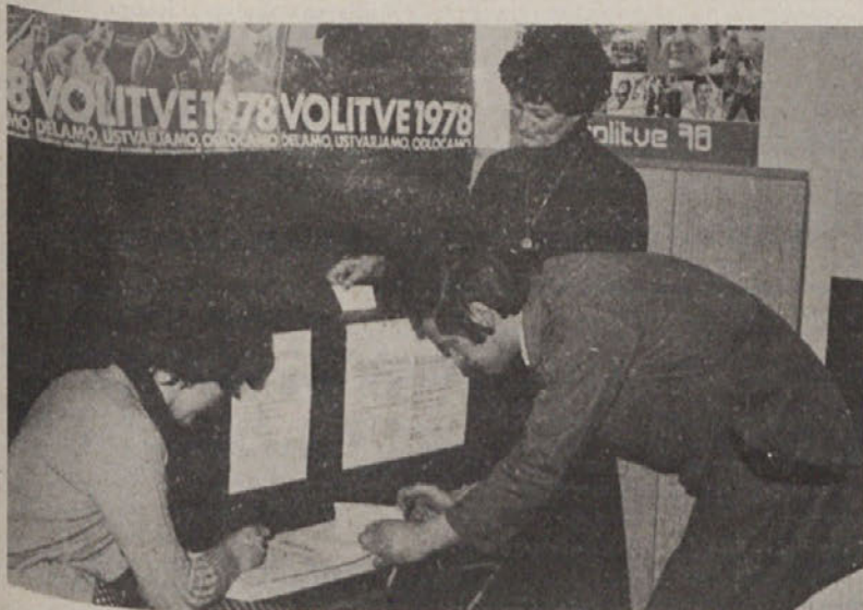
Delavci v delovnih organizacijah so že v jutranjih urah opravili svojo dolžnost in izvolili tiste, ki so jim zaupali delegatske funkcije